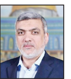
عزت الرشق عضو المكتب السياسي لحركة حماس

الإبادة على غزة، مستدعياً أكاذيب وأساطير تلمودية، تؤكد أن المصفيقين له لا يعيرون اهتماماً لأي قيمة، سوى البطش والتتكيل والإبادة. إن هذا الاحتفاء الذي ناله نتنايهو على افتراءاته من قبل أعضاء الكونغرس، يدل على أنهم اختاروا أن يكونوا جالسين في المكان الخطأ في لحظة تاريخية ستلاحقهم وتسجلهم كشركاء في تلك الإبادة.