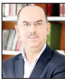
كرم كرامة كاتب عراقي مقيم في لندن

عملية احتيالية، ولكنها قد تتحول إلى فوضى وانقسام. أما أولئك الذين لن يفصحوا المجال للجليل القادم سوف يجرفهم الزمن. كان الرئيس بايدن يأمل في تجاوز هذه القاعدة الحديدية التي تحكم كلا من البيولوجيا والسياسة، والرئيس الذي يخفي وراء نظرات شمسية باهظة الثمن لا يخدع الناس لأنهم قادرون على قراءة التقييم وتأثير السنين، لذلك طالب الأمريكيون بصفحة بايدن منذ عام أو أكثر. لكنهم أيضاً لا يرون الحل أو الأمل في ترامب. لا بايدن ولا ترامب ولا كاميليا يضعون البلاد فوق الذات، كما يزعمون، والدستور فوق الصموح الشخصي، ومستقبل الديمقراطية فوق المكاسب الزمنية. لكن الأمر في النهاية متروك للأمريكيين بعد أن اكتشفوا أن الديمقراطية ليست حقيقية، إن لم يضح قهرها الأسن بالدماء التي سفكت في داخل وخارج الولايات المتحدة. نقلا عن «الحوار المتحدن»