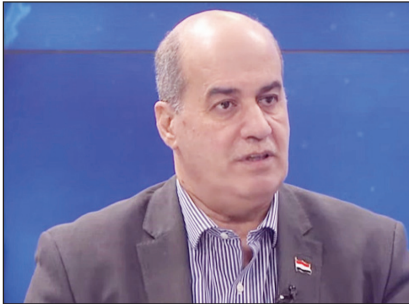
المترو وتمت دراسة المناطق وكانت هناك جولات في بغداد قمتا بها أكثر من ٢٠ مرة

وأشار إلى أن «المشروع يعد الأكبر في المنطقة وسيحل من أزمة النقل وبشكل كبير»، معرباً عن أمله في أن «يكون المشروع عالمياً».