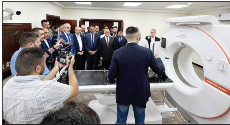
بغداد/ الزوراء: وقال وزير الصحة صالح الحسناوي افتتح وزير الصحة صالح الحسناوي مركزاً للأورام في مدينة الإمامين الكاظمين (ع) الطبية. وكانت هناك جولات في بغداد قمتا بها أكثر من ٢٠ مرة

وأضاف أن «المجلات تعمل وفق الإدارة الالكترونية ومراقبة وعلاج المريض اشعاعياً عن بعد - تعمل على علاج الأورام السرطانية بالأشعة السينية العميقة - يحتوي على منظومة أجهزة طبية متكاملة مفراس وتخطيط وفق أحدث المواصفات».