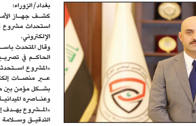
بغداد/الزوراء: كشف جهاز الأمن الوطني عن استحداث مشروع الأمن المناطقي الإلكتروني.

بغداد/الزوراء: واختصارها من عدة أسابيع إلى 48 ساعة، وأضاف أن «المشروع سيسهم في تحقيق الرؤية الحكومية الرامية إلى تبسيط الإجراءات وتقليل الجهد البشري الحاكم في تصريح صحفي إن «المشروع استحدثه الجهاز يعمل عبر منصة إلكترونية تربط بشكل يومي بين مقرات الجهاز وعناصره الميدانية»، لافتاً إلى أن «المشروع يهدف إلى تسريع آليات التدقيق وسلامة الموقف الأمني والأجهزة الأمنية والحكومية».