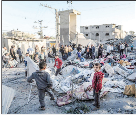
بغداد/ متابعة الزوّار:

قالت وكالة رويترز، إنه من المتوقع أن يستأنف رئيس الموساد الإسرائيلي يوسي كوهين محادثات وقف إطلاق النار في غزة مع رئيس الوزراء القطري الشيخ محمد بن عبد الرحمن آل ثاني، ومسؤولين مصريين، في الدوحة اليوم الأحد.