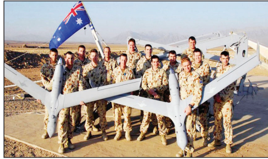
لندن/ متابعة الزوّار:

ذكرت صحيفة "الغارديان" البريطانية أن وثائق خاصة بمجلس الوزراء الأسترالي تعود إلى فترة حرب العراق عام 2003، تظهر أن حكومة جون هوارد، كانت تعتز في ذلك الوقت بمصالحها متوافقة بدرجة كبيرة مع مصالح الولايات المتحدة، وأن القدرة على الوصول إلى نفط الشرق الأوسط، يمثل مصلحة وطنية رئيسية لأستراليا، فيما لفت التقرير إلى أن مجلس الوزراء الأسترالي كان بكامل هيئته ووقع رسمياً على انخراط أستراليا في 18 آذار/ مارس 2003 بناءً على "تقارير شفوية من رئيس الوزراء"، وليس على أساس مخططات تفصيلية، وجرى نشر القوات الأسترالية مسبقاً.