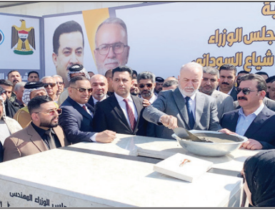
بغداد/الزوراء: وضع محافظ بغداد، عبد المطلب العلوي حجر الأساس لمشروع مجاري النهروان الاستراتيجي، فيما فصل المشروع.

الاستراتيجي، إن المشروع، واحد من خمسة مشاريع استراتيجية للناصية، وبمكمل مشاريع مجاري سبع البور وأبو غريب والوحدة والرشيدية». وأضاف أن «المشروع يشمل تصريف مياه الأمطار والصرف الصحي لجميع أحياء مناطق النهروان بواقع 8 أحياء، ويقدم خدمات الصرف الصحي لأكثر من 40000 نسمة لغاية سنة 2042». وأشار إلى أن «مدة إنجاز المشروع 4 سنوات وبتكلفة تقبلياً تصل إلى أكثر من 17 ألف متر مكعب في اليوم الواحد للمرحلة الأولى، أما المرحلة الثانية بتكلفة تقبلياً بواقع 100 ألف متر مكعب يومياً بعد الانتهاء من المرحلة الأولى». ولفت إلى أن «معدات المشروع من الأسمنت الموضوعة 800 طنناً سنوياً في حين بلغت المنطقة المخدومة (4120) ألف يوم، مؤكداً أنه «ستتم عملية المباشرة بالخدمات الفوقية كالإسكاف وربط الشبكات وفرش المقرض والحدائق بعد الانتهاء من مد خطوط التصريف».