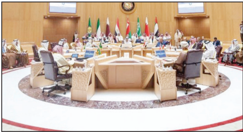
الأردني؛ لبحث قرار تأسيس علاقات استراتيجية مع المملكة الهاشمية، يليه اجتماع مع وزير الخارجية المغربية لبحث العلاقات الثنائية.

مصر والأردن والمغرب؛ كل على حدة؛ لبحث عديد من الأمور، منها: دراسة خطة العمل المشترك مع الجانب المصري حول القضايا الشائكة. من جهته، قال وزير الخارجية المصري سامح شكري: "لا حل للصراع القائم إلا بإقامة دولة فلسطينية، وأزمة غزة تسببت في نزاعات إقليمية خطيرة، حيث إن التصعيد في غزة امتد إلى البحر الأحمر وباب المندب، والحلول الأمنية للصراع لم تقدم للمنطقة سوى الدمار". وقال شكري: "ما يجري في غزة مخطط ممنهج تصفية القضية الفلسطينية". وسيستيع اجتماع دول التعاون مع الجانب المصري، اجتماعاً آخر مع وزير الخارجية