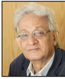
عبدالله السناوي كاتب وصحفي مصري

في حربي أوكرانيا وغزة يجد الرئيس الأمريكي جو بايدن نفسه أمام المأزق المزدوج قد يكلفه خسارة الانتخابات الرئاسية نوفمبر المقبل.