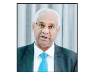
فيصل محمد صالح وزير الإعلام السوداني السابق

المرء يكون قد أراح ضميره، وفعل ما ينبغي عليه أن يفعله. تبقى المشكلة مع الجناح الآخر، الذي يعرف ويقر بالوقائع والأحداث، ثم يعد أن كشفها والكتابة عنها خيانة وطنية. هذا منطق يصعب ابتلاعه أو التفاهم معه، لأنه يظن أن العالم لا يزال يعيش في القرون الوسطى، حيث لا يعرف الناس ما يجري في القرية المجاورة، هذا من ناحية، ولأنه، من ناحية أخرى، يظن أن إخفاء المعلومة علاج ناجح وكاف، ونفس الجناح جاء بمنطق آخر، يتعلق بالجانب الذي يقف فيه من طرفي الحرب، فقد افترض أن علينا أن نكتب عن جرائم «قوات الدعم السريع» التي ارتكبتها أينما حلت، وهي جرائم وصلت أقصى مراحل البشاعة، ولكن إن توافرت لدينا دلائل ووقائع لجرائم ارتكبتها منسوبيون للجيش السوداني، فيجب عدم الإشارة إليها، لأن هذا جيشنا الوطني الذي ينبغي ألا نشوه سمعته، وإن وقعت منه جرائم أو أخطاء فهي يجب أن تكون ضمن الذنوب المغفورة. هذا منطق معكوس، فالجيش الوطني الذي صرف عليه الشعب السوداني، واقتطع من قوته الشحيح وأقام له الكليات العسكرية والمعاهد ومراكز التدريب، وحمله المسؤولية الوطنية والأخلاقية لحماية الوطن والشعب، يجب أن يكون الأكثر تمسكاً بالقيم الإنسانية والأخلاقية