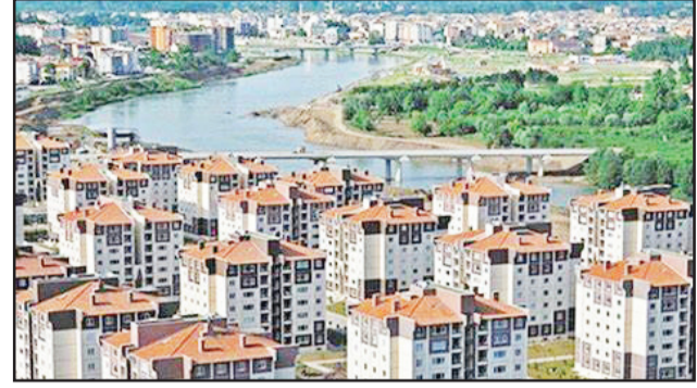
بغداد/ متابعة الزوراء:

أعلنت هيئة الإحصاء التركية أن العراقيين احتلوا المرتبة الرابعة بين الدول بين الدول الأكثر شراء العقارات التركية خلال شهر كانون الثاني/يناير. وقالت الهيئة في تقرير اطلعت عليه "الزوراء" ان المبيعات المنخفضت بنسبة 50.5% في كانون الثاني مقارنة بنفس الشهر من العام 2022 وبلغت 2000 و61 منزلاً، وحصلت اسطنبول المرتبة الاولى 747 منزلاً، تليها انطاليا 710 منزلاً، ومن ثم جاءت مرسين 211 منزلاً. كما أشارت الهيئة إلى أن "الروس تصدروا باقي الدول في الأكثر شراء للعقارات في تركيا خلال كانون الثاني وبعده 555 منزلاً، وجاء الإيرانيون المرتبة الثانية حيث اشترى 208 منازل، اوكرانيا ثالثاً بـ 127 منزلاً، ومن ثم جاء العراق بالمرتبة الرابع بـ 99 منزلاً. وأعلنت هيئة الإحصاء التركية، مطلع العام 2024، ان العراقيين احتلوا المرتبة الخامسة بين أكثر الدول بشراء العقارات التركية خلال شهر كانون الاول / ديسمبر الماضي. وطالما تصدر العراقيون دول العالم في قائمة شراء المنازل في تركيا منذ العام 2015، إلا أن ترتيبهم تراجع للمركز الثاني بعد إيران مع بداية العام 2021، قبل أن يتراجع للمركز الثالث منذ شهر نيسان 2022 بعد هيمنة روسية على العقارات التركية .