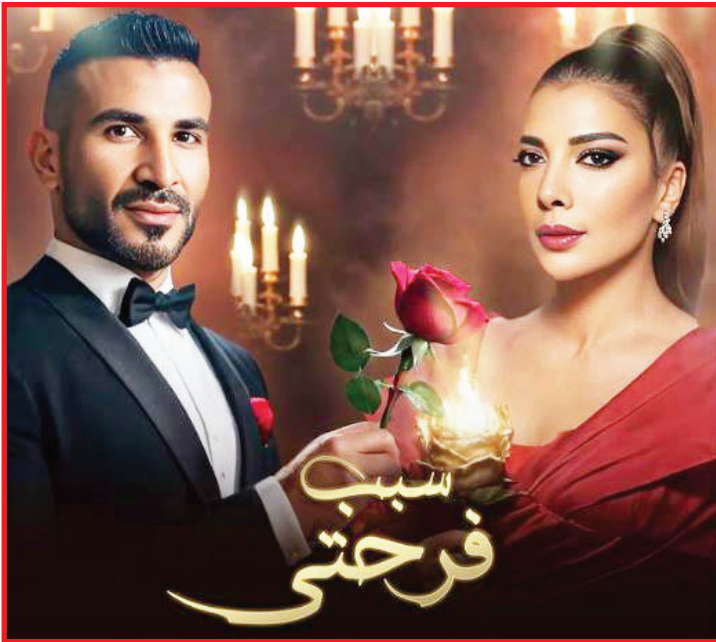
فجر النجم المصري أحمد سعد والنجمة السورية أصالة مفاجأة مميزة أعلنتها من خلالها عن تعاون يجمعهما، وأكد أحمد سعد أن هذا التعاون سيكون بمناسبة الاحتفال بيوم الحب.

يوم الحب في الرابع عشر من شباط / فبراير 2024، ونشر أحمد سعد صورة بوستر الأغنية عبر حسابه الرسمي على موقع التواصل الاجتماعي «إنستغرام» حيث ظهرت أصالة بإطلالة باللون الأحمر بينما أحمد سعد يقدم لها وردة حمراء كدلالة على الاحتفال بيوم الحب. وقال أحمد سعد في تعليقه على الصورة: «أصالة.. أحمد سعد.. «سبب فرحتي».. أغنية عبد الحبيب». وكذلك فعلت النجمة السورية أصالة حيث قالت في تعليقه: «صداقتنا فيها كل المواقف الطوه ونكرياتنا بنسحق ترجمها فنُّ وهو أهل مامنك». وتفاعل عدد كبير من المتابعين مع هذه المفاجأة الجميلة معبرين عن شوقهم لسماع الأغنية الجديدة. وكانت المطربة أصالة، قد طرحت قبل أيام الجزء الثاني من ألبومها الغنائي «لحقت نفسي»، عبر قناتها الرسمية على موقع الفيديوها الشهر «يوتيوب» وجميع المنصات الموسيقية.