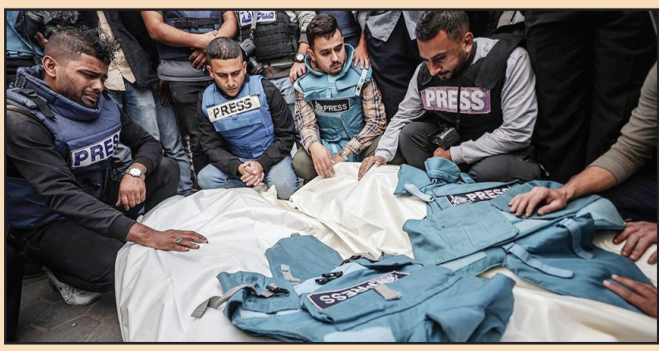
التفاصيل ص 3

أن استهداف الصحفيين عمداً يعد انتهاكاً للقانون الدولي وجريمة حرب». وذكر داوسون أن غزة تحولت إلى «مدينة أشباح» نتيجة الهجمات الإسرائيلية المستمرة، وأن الناس يجالسون البقاء على قيد الحياة دون توفر الظروف الإنسانية الأساسية، و«مفجع». وقال داوسون: «بموجب القانون الدولي يجب على القوات المسلحة أن تعتبر الصحفيين مدنيين وأن تضمن سلامتهم. ومن الواضح