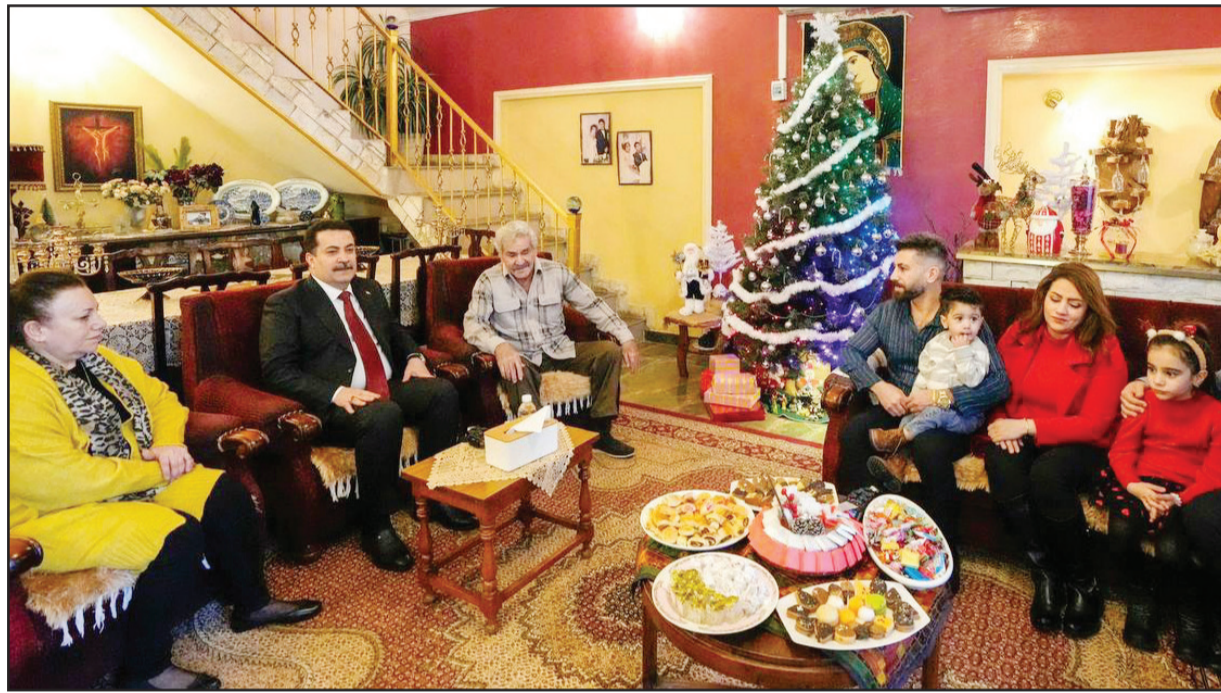
التفاصيل ص 3