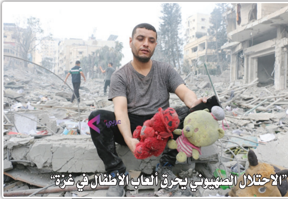
"الاحتلال الصهيوني يحرق ألعاب الأطفال في غزة"