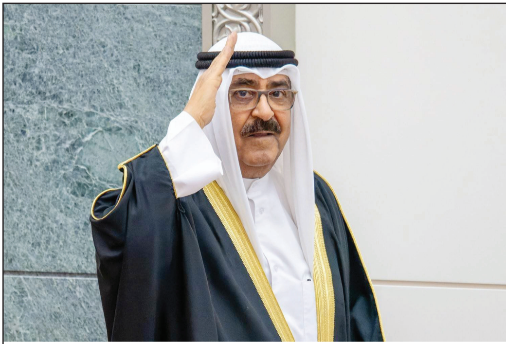
أمير الكويت الشيخ مشعل الأحمد الصباح

كما أعلنت حكومة الكويت، الحداد على وفاة أمير البلاد، معلنه الحداد على وفاة أمير البلاد لمدة 40 يوماً وإغلاق الدوائر الرسمية لمدة ثلاثة أيام. وكان الديوان الأميري الكويتي أعلن عبر التلفزيون الرسمي، ظهر أمس السبت، وفاة أمير البلاد الشيخ نواف الأحمد الصباح عن عمر ناهز 86 عاماً، وذلك بعد ما يزيد قليلاً عن ثلاث سنوات من توليه السلطة في البلاد. ودخل الشيخ مشعل الأحمد الجابر الصباح، الأمير الـ17 للكويت، الحياة السياسية من بوابة العمل الأمني والعسكري الذي قضى فيه أكثر من 56 عاماً منذ تخرج في كلية هندن للشرطة في بريطانيا عام 1960، وأصبح رئيساً للمباحث العامة لمدة 13 عاماً (من عام 1967 إلى 1980)، وتحول هذا الجهاز على يديه إلى إدارة جهاز أمن الدولة، الذي لا يزال يحمل هذا الاسم. كما عُيّن نائباً لرئيس الحرس الوطني بدرجة وزير في 13 أبريل 2004، وهو جهاز عسكري مستقل عن قوات الجيش والشرطة، ويهدف إلى مساعدة القوات المسلحة وهيئات الأمن العام والمساهمة في أغراض الدفاع الوطني، وظلّ الشيخ مشعل، الذي يوصف بأنه واحد من أهم رجال الأمن في الكويت، يتدرج في مناصبه بوزارة الداخلية، حتى عينه الشيخ جابر في 2004 نائباً لرئيس الحرس الوطني بدرجة وزير، وظل في هذا المنصب حتى توليه ولاية العهد في 8 أكتوبر 2020 بتزكية من أخيه الأمير الراحل الشيخ نواف الأحمد الجابر الصباح، ومبايعة مجلس الأمة. ولد الشيخ مشعل الأحمد (مواليد 27 سبتمبر 1940) في الكويت، وتربى في كنف العائلة الحاكمة، فهو النجل السابع من أنجال حاكم الكويت أحمد الجابر الصباح (الأمير العاشر من أمراء الكويت)، وأخ لثلاثة حكام هم: الشيخ جابر الأحمد الصباح، والشيخ صباح الأحمد الصباح، والشيخ نواف الأحمد الصباح.