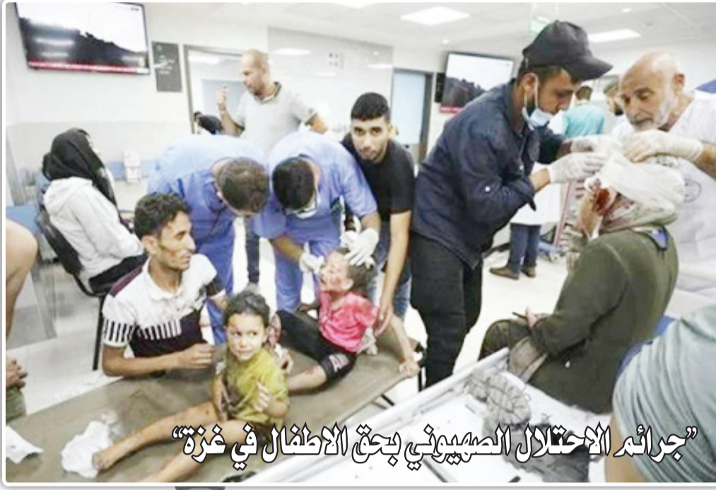
«جرائم الاحتلال الصهيوني بحق الاطفال في غزة»