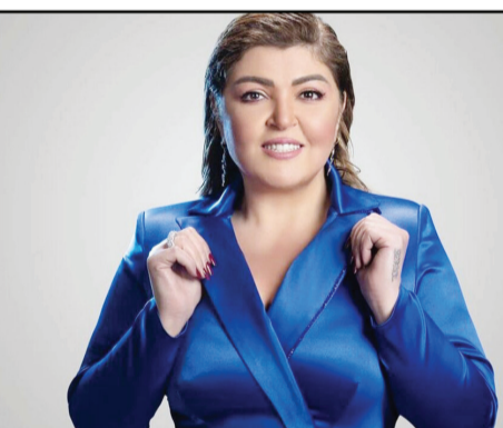
يجب أن يتم إدخال مصر في هذا، والوطن أكبر من هذه الأشياء.