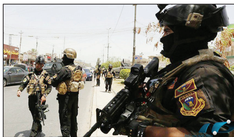
بغداد/ الزوراء: أعلنت مديرية الاستخبارات العسكرية القبض على ثلاثة متهمين بالإرهاب في محافظتي الأنبار والربيعين. وذكر بيان للمديرية تلقت «الزوراء» أنه «ضمن جهودها الملاحقة ما تبقى من فلول عناصر عصابات داعش الإرهابية واستناداً إلى معلومات استخبارية دقيقة لشعبتي قياتي الفرقتين العاشرة والسابعة عشرة والتعاون مع استخبارات وقوة اللواءين الأربعين والخامس والخمسين ومن خلال كمانئ محكمة نصبتها المفاز، تمكنت من إلقاء القبض على (3) متهمين مطلوبين للقضاء العراقي وفق أحكام المادة (4 / إرهاب) في سيطرتي الصقور والانتصار التابعة إلى قضاء الفلوجة ومنطقة الرضوانية».

وأضاف أن «المتهمين، كانوا يعملون مؤكداً «تسليمهم إلى جهات الطلب ويتنمون إلى عصابات داعش الإرهابية»، أصولياً».