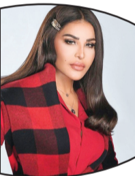
البرنامج الموسيقي إلى أن يكون جسر تواصل فنياً بين ثقافات الدول العربية الموسيقية في الماضي والحاضر، والاحتفاء بالآراث الفني لشعوبها، ويستضيف فنانيين وفنانات من كل الوطن العربي.

وكتبت: "تشاهدون الآن على قناة أبو ظبي... موضوعات شيقة، وأغنيات ممتعة في ليلة مغربية ساحرة.. النجمة أحلام تستضيف أسماء المنور وحاتم عمور في أولى حلقات برنامجها أحلام في ألف ليلة وليلة، وفي مقطع فيديو أيضاً من البرنامج، ظهرت أحلام مع أسماء المنور، وقالت: "النجمة أحلام تطلب من ضيفتها أسماء المنور التوقيع على تعهد... فهل تقبل؟"، وطلبت الفنانة الإماراتية من المغربية أن تنازل لفنان عن أغنية من أغنياتها، وألا تحاسبها إذا قدّمها. وتمّ اختيار أحلام من قبل شبكة أبو ظبي للإعلام لتقديم برنامج "أحلام في ألف ليلة وليلة"، وهي ليالٍ من الفن الأصيل، ويهدف