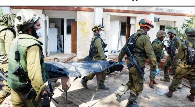
عسكرية لجنوده في خان يونس جنوبي

من نوع ميركافا بقذائف «اللياسين ١٠٥»، شمال مدينة خان يونس. كما أعلن الجيش الصهيوني عن مزيد من الخسائر في صفوفه مع اشتداد المعارك مع المقاومة الفلسطينية في محاور عدة بقطاع غزة، حيث اضطر لتنفيذ إنزال مظلي لإيصال الإمدادات لجنوده، في حين قصفت كتائب القسام مدينة تل أبيب وضواحيها بدفعات من الصواريخ. واعترف الجيش، أمس الاثنين، بمقتل ٧ عسكريين بينهم ٥