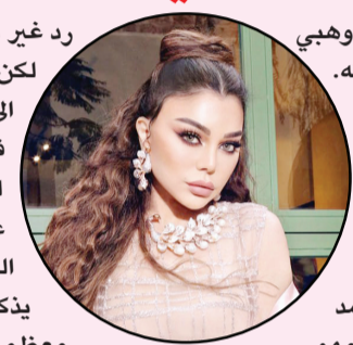
فيما تتحضر لمجموعة من الأعمال الفنية التي تنتظر موافقتها هي قبل أي تفاصيل أخرى.

رد غير مناسب ولم يكن الأمر بحاجة لذلك. لكن في المقابل، علم أن بيومي فؤاد سيعود إلى الفيلم، ليشارك وهبي في دورها عن فتاة تحاول بكل ما أوتيت من قوة للفوز والنجاح في الحياة، ما يعكس على محيطها، في إطار لا يخلو من بعض الكوميديا والسخرية. يذكر أن هيفاء وهبي أعدت نفسها عن معظم الفعاليات الفنية، لأسباب لم تعرف. فيما تتحضر لمجموعة من الأعمال الفنية التي تنتظر موافقتها هي قبل أي تفاصيل أخرى.