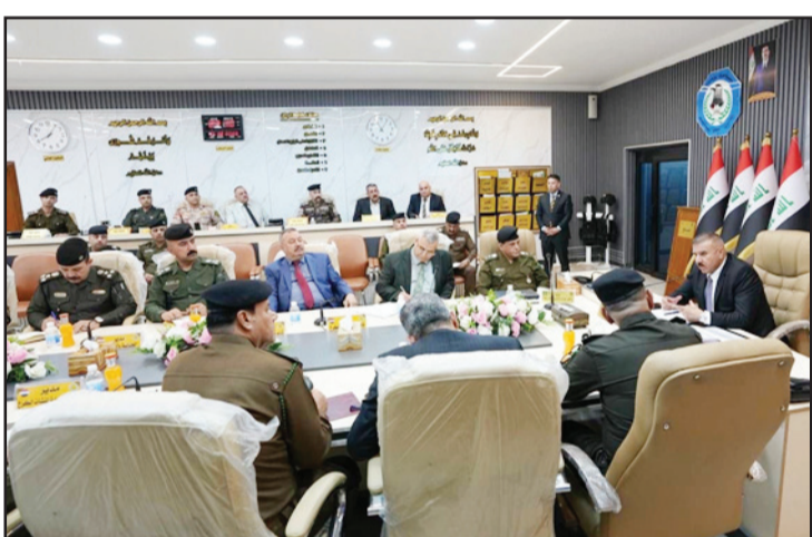
بغداد/ الزوراء: وقالت الوزارة في بيان تلقت «الزوراء» إن «وزارة الداخلية تواصل تطوير عملها الأمني والخدمي في مختلف مناطق البلاد، إذ افتتح وزير الداخلية

بغداد/ الزوراء: أعلنت وزارة الداخلية في بيان تلقت «الزوراء» وجه وزير الداخلية عبد الأمير الشمري بالاستعداد التدريجي لتسليم الملف الأمني في العاصمة بغداد وتعزير الأمن والاستقرار، مشدداً «على محاربة الفساد».