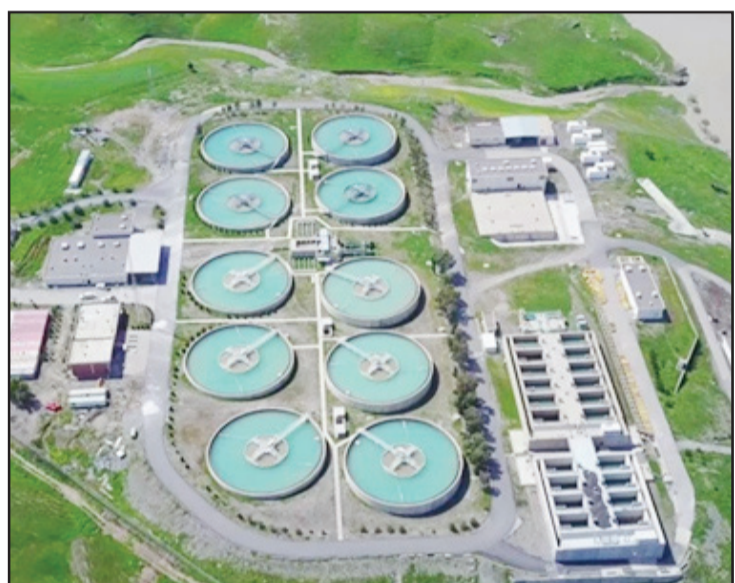
أربيل/ الزوراء: أكدت محافظة أربيل، أن الحكومة الاتحادية خصصت 14 مليار دينار لعدد من المشاريع المتعلقة بمواجهة

تداعيات التغيرات المناخية، شح المياه والسيول في المحافظة. وذكرت المحافظة في بيان تلقته «الزوراء»، أن «المبلغ لم يرسل بعد، وسيودع في حساب محافظة أربيل في غضون الأيام القادمة بعد الانتهاء من الإجراءات الإدارية». وأضافت، أن «المحافظ أوميد خوشناو قدم مشروعاً لمواجهة تداعيات التغيرات المناخية، شح المياه والسيول إلى رئيس الوزراء العراقي محمد شياع السوداني خلال زيارته إلى أربيل في آذار الماضي، بكلفة 14 دينار دينار». وأشارت إلى أن «السوداني ترأس في 13 من تشرين الثاني الجاري اجتماع اللجنة العليا الوطنية للمياه الذي شارك فيه وفد إقليم كردستان، وشهد مناقشة مشروع محافظة أربيل». ولفتت إلى أن «اللجنة وافقت بالإجماع على مشروع محافظة أربيل وإرساله إلى مجلس الوزراء العراقي للبدء بإجراءاته».