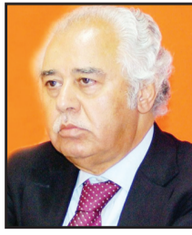
عبدالحسين شعيان كاتب ومفكر عراقي

وأخريين لجأوا إليه هرباً من حجم قصف الطائرات، وأنها تختبي داخل أنفاق تحت المبنى، وتدير منها عمليات عسكرية. لم يكن سهلاً على ماكينه حرب إسرائيل الإعلامية تسويق ادعاءات كهذه للرأي العالمي، خصوصاً أن الحرب تستمر بكل أوارها على جبهات ومناير «السوشيال ميديا»، حيث تتصدى مجموعات الشبان والشابات من المجتمعات العربية كافة، بل ومن مختلف الجنسيات في العالم كله، للمزاعم الإسرائيلية، فتندنها وتكشف جوانب الزيف فيها. أمام هذا العجز الفاضح، اضطر جهاز دعاية قوات الاحتلال الإسرائيلي إلى السماح بدخول كاميرات تلفزيون عالمية إلى أنفاق، كي تسجل لقطات تُظهر قطع سلاح متنوعة، ويضع أوراق معبّرة، وجهاز «لابتوب». ربما صدق البعض ما عُرض على الشاشات. ولكن لم يبد أن الجهد المبذول قد أفلح في إقناع قطاعات أعرض من الرأي العام العالمي، إزاء موقف كهذا، سوف تبرز مقولة ذاع صيتها منذ زمن بعيد: «ربما تخدع بعض الناس بعضاً من الوقت، لكنك لن تنجح في خداع كل الناس كل الوقت»، فهل تأخذ بها أجهزة إعلام الحرب الإسرائيلية؟ كلا، أشك في ذلك. مساء الأحد قيادات «حماس» الميدانية تندس في المستشفى بين زلزاله المرضى،