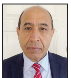
حميد الكفائي باحث عراقي في الشؤون السياسية والاقتصادية

الوطني، فإن شركاءها التجاريين سيجوون إلى اتخاذ إجراءات عقابية مماثلة، لحرمانها من الاستفادة من التجارة الحرة. التعرفات لا تجلب بالضرورة إيرادات إضافية لخزينة الدولة، لأن الإيرادات المتأتبة منها، تجلب إيرادات أخرى قد تفوقها حجماً وديمومة، كتلك الناتجة من تقلص الصادرات بسبب الإجراءات الحمائية. مثل هذه الإجراءات الضائعة كان يمكن أن تتحقق عبر تنمية الصادرات وتشجيع التنافس لتحسين الإنتاج الوطني، وهذا ينطبق بالدرجة الأساس على الدول المتقدمة صناعياً، والتي يمكنها أن تحقق تفوقاً عبر تطوير صناعات أفضل من المستوردة. كما لا يمكن التعرفات، أو الإجراءات الحمائية عموماً، وحدها، أن تشجع المنتجات الوطنية، أو تعيد التوازن إلى الميزان التجاري، المختل بسبب تفوق الواردات على الصادرات. صحيح أنها تنتفع المنتج الوطني بتعزيز حصته من السوق المحلية، وذلك لارتفاع أسعار المنتجات الأجنبية بالمقارنة، لكن عدم وجود المنافسة لا يشجع التطور والابتكار وتحسين الإنتاج وخفض الأسعار.