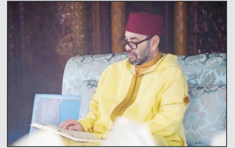
الرباط / متابعة الزوراء:

بعث الملك محمد السادس برقية تعزية ومواساة إلى أفراد أسرة المرحوم الإعلامي محمد بنددوش. وجاء في البرقية الملكية: "فقد تلقينا ببالح التأثر نعي المشمول بعفو الله تعالى ورضاه، المرحوم الإعلامي الوطني البارز محمد بنددوش، تغمده الله بواسع الرحمة والغفران، وجعله من المنعم عليهم بفسيح الجنان". وأضاف الملك: "بهذه المناسبة المحزنة، نعرب لكم ومن خلالكم لكافة أهلكم وذويكم، ولأسرة الفقيد الإعلامية الوطنية، ولسائر أصدقائه ومحبيه، عن أحر تعازينا وأصدق مشاعر مواساتنا، في فقدان أحد قيومي الإذاعيين المغاربة المشهود له بدماثة الخلق، وبالغيرة الوطنية الصادقة وبالولاء الثابت لمبادئ المهنة التي جسدها، رحمه الله، بكل تفان وإخلاص، وكفاءة وإقتدار، على امتداد عقود من مساره المهني الحافل بالعباءة؛ مما جعله يحظى بتقدير واحترام مختلف الفاعلين الإعلاميين". وقال محمد السادس في هذه البرقية: "وإذ نشاطركم أحزانكم إزاء هذا المصاب الأليم، فإننا نضرع إلى العزيز الوهاب أن يلهمكم جميل الصبر وحسن العزاء، وأن يوفى فقيديكم العزيز أحسن الجزاء وأجزل الثواب عما أسداه من جليل الأعمال والخدمات لوطنه في تعلق متين بأهداب العرش العلوي المجيد، ويتقبله في عداد الصالحين من عباداه، مع الذين أنعم الله عليهم من الصديقين والشهداء والصالحين، وحسن أولئك رفيقاً". وبتشور الصابرين الذين إذا أصابهم مصيبة قالوا إنا لله وإنا إليه راجعون، أولئك عليهم صلوات من ربهم ورحمة وأولئك هم المهندتون".