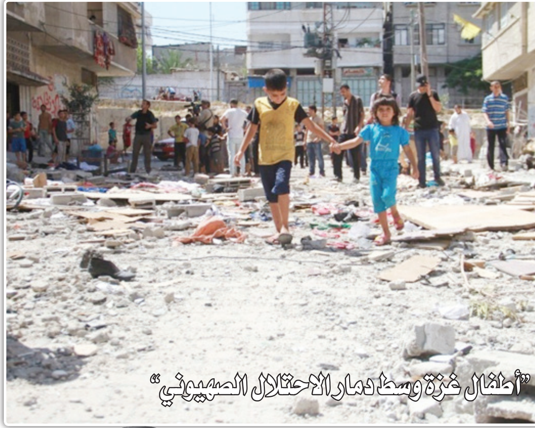
أطفال خربة وسط دمار الاحتلال الصهيوني