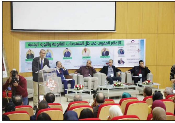
ملازمة التحولات التي يعرفها حقل الحلول وإعلام المينافيرس. وحاول المشاركون في هذا اللقاء الصحافة والإعلام، مع تطوره قانونياً

يذكر أن هذه الندوة شكّلت مناسبة لتكريم الجهة المنظمة لمجموعة من الشخصيات الإعلامية التي خدمت الفعل الإعلامي بوجودة وجهة الشرق على مدى عقود، فضلاً عن فعاليات ثقافية وفنية ومجتمعية.