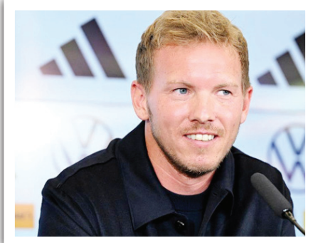
رغم ذلك، أشار ماتيسوس إلى الإضافة التي قدمها هافيرتز في هذا المركز على الصعيد الهجومي، ضحية:

برلين / متابعة الزوراء: طالب لوتار ماتيسوس، أسطورة بايرن ميونخ، جوليان ناجلسمان، مدرب منتخب ألمانيا، بعدم تغيير مركز كاي هافيرتز، متلماً حدث في مواجهة تركيا الودية. وتلقى المناشقات أول هزائمه في عهد ناجلسمان، الذي تولى المهمة قبل بضعة أسابيع، ليقود الفريق في 3 مباريات ودية. وكتب ماتيسوس في مقاله عبر شبكة «سكاي سبورتنس»: «بحكم خبرتي، يمكنني القول إن ناجلسمان لم يمر بالكثير من التجارب في بداية مشواره مع المناشقات، بخلاف ما حدث مع سلفه هانز فليك». وأضاف: «لقد حاول تجربة كاي هافيرتز أمام تركيا كظهير أيسر، ورغم جودته، إلا أنه لم يسبق له اللعب في هذا المركز».