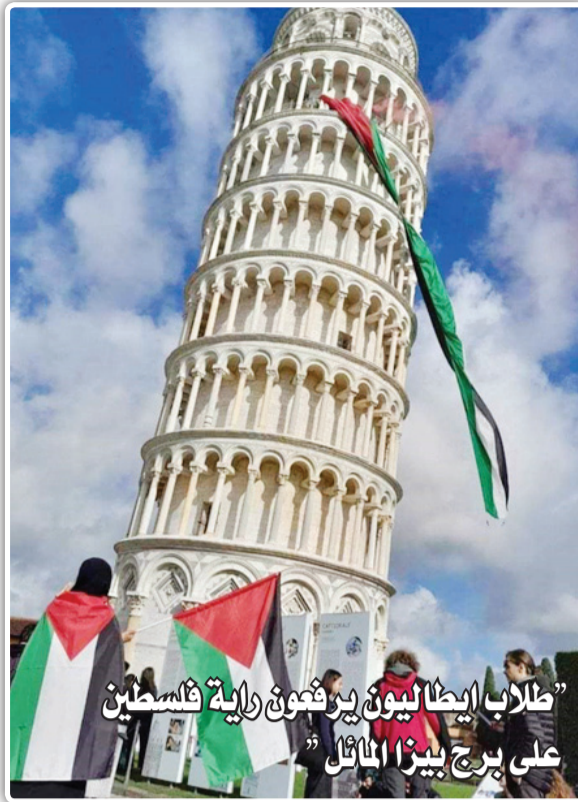
طلاب إيطاليون يرفعون راية فلسطين على برج بيزا المائل