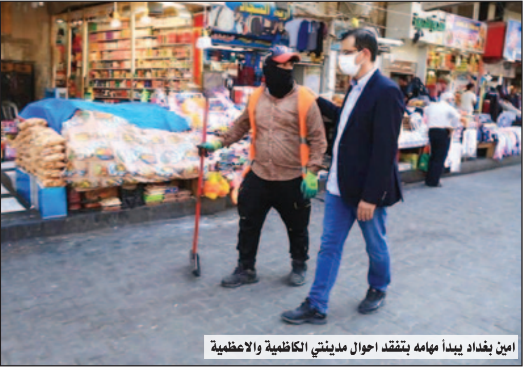
امين بغداد يبدأ مهامه بتفقد احوال مدينتي الكاظمية والاعظمية

من السن التقاعدية، لكون الدولة قد صرفت عليهم اموالا كثيرة وليس لها البدلاء عنهم، مما يؤدي الى فراغ حقيقي لمواقعهم. وأشار الى: ان مقترح تعديل القانون بما ان فيه جنبه مالية فإنه يفترض اخذ رأي الحكومة بذلك.