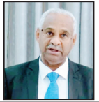
فيصل محمد صالح وزير الإعلام السوداني السابق

وللأسباب نفسها غابت محطات التلفزة الخاصة، وعشرات من محطات السراف إم» الخاصة، التي ارتبطها ببيئة البث من ناحية، ولوجود مبانيها ومكاتبها في مناطق الحرب، وبعد أسابيع من الحرب بدأ تلفزيون السودان البث عبر إحدى المحطات الإقليمية؛ لكن انحصرت البرمجة في مواد التغطية والحشد العسكري. وكانت الصحف المطبوعة تعاني من الأوضاع الاقتصادية المتردية، والتي أثرت على مصطلحات إنتاج الصحف وارتفاع تكلفتها، مع ضعف حركة الطباعة والتوزيع، وتوقف كثير منها طواعية، بينما ظلت قلّة قليلة تتأخّر للبقاء على قيد الحياة، ثم جاءت الحرب لتقتضي على فرص بقائها بشكل تام، ومع الأسباب نفسها توقفت محطات الإذاعة والتلفزيون، لوجود مكاتب الصحف والمطابع في قلب الخرطوم التي لا تزال منطقة حرب لا يمكن الاقتراب منها. ومنذ سنوات بدأت الصحف الإلكترونية في الظهور؛ لكنها لا تزال بعد هذه السنوات تتعثر وتعجز عن أن تتجذّر لها مكاناً عند القراء، أو تغطي تكلفتها من الإعلانات والإشتراكات، أو أي كان مطلع الصحف التي تحمل اسم «صحافة إلكترونية» تحمل مشروع شخصي لأفراد يحملون عبء مطاردة الأخبار وصياغة التقارير، ثم نشر مقالات رأي لكتاب بعضهم غير معروف، بجانب إعادة نشر مواد من صفح ومواقع عربية وأجنبية، من دون الحصول على إذن واحترام حقوق الملكية الفكرية، وغاب السلوك المهني في مراجعة الأخبار وصياغة قبل نشرها ومراجعة معلوماتها ومصادرهما، ثم إعادة صياغتها على أسس مهنية وسياسية وقانونية سليمة. هكذا غاب الإعلام المؤسسي، إن صحّت التسمية، والقصور إعلام مؤسسات؛ سواء كانت صحفياً أو خاصة، ودخل سوق الإعلام