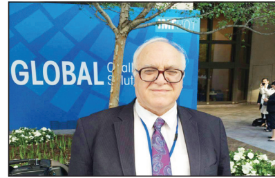
بغداد / الزوراء: