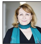
إنعام كهي جي صحفية روائية عراقية