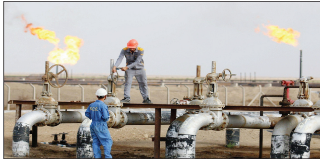
كمية من روسيا أو ليبيا". من جانب متصل، حقق خام البصرة على مكاسب كبيرة بسبب شح العرض بعد أن قلصت السعودية ودول أوبك الإمدادات. وأغلق خام البصرة الثقيل في آخر جلسة من يوم الجمعة على ارتفاع

بغداد / متابعة الزوراء: أعلنت إدارة معلومات الطاقة الأمريكية، أمس الأحد، عن ارتفاع صادرات العراق النفطية لأمريكا لتتجاوز بذلك السعودية خلال الأسبوع الماضي. وقالت الإدارة في جدول لها اطلعت عليه "الزوراء" إن "متوسط الاستيراد الأمريكي من النفط الخام خلال الأسبوع الماضي من ثمانية دول رئيسية بلغت 5.487 ملايين برميل يومياً منخفضة بمقدار 770 مليون برميل باليوم من الأسبوع الذي سبقه، والذي بلغ 6.257 ملايين برميل يومياً". وأضافت أن "صادرات العراق النفطية لأمريكا بلغت معدل 273 ألف برميل يومياً الأسبوع الماضي، مرتفعة بمقدار 14 برميل كمعدل يومي عن الأسبوع الذي سبقه والذي بلغ الصادرات النفطية لأمريكا فيه بمعدل 259 مليون برميل يومياً، وذلك تتجاوز العراق السعودية في صادراته لأمريكا". وأشارت إلى أن "أكثر الإيرادات النفطية لأمريكا خلال الأسبوع الماضي جاءت من كندا بمعدل بلغ 3.203 ملايين برميل يومياً، تلتها المكسيك بمتوسط 830 مليون برميل يومياً، وتلتها بريطانيا بمتوسط 787 مليون برميل يومياً، ومن ثم اليابان بمتوسط 242 مليون برميل يومياً". وأشارت إلى أن "أكثر الإيرادات النفطية لأمريكا خلال الأسبوع الماضي جاءت من كندا بمعدل بلغ 3.203 ملايين برميل يومياً، تلتها المكسيك بمتوسط 830 مليون برميل يومياً، وتلتها بريطانيا بمتوسط 787 مليون برميل يومياً، ومن ثم اليابان بمتوسط 242 مليون برميل يومياً". وأشارت إلى أن "أكثر الإيرادات النفطية لأمريكا خلال الأسبوع الماضي جاءت من كندا بمعدل بلغ 3.203 ملايين برميل يومياً، تلتها المكسيك بمتوسط 830 مليون برميل يومياً، وتلتها بريطانيا بمتوسط 787 مليون برميل يومياً، ومن ثم اليابان بمتوسط 242 مليون برميل يومياً".