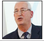
الدكتور صالح المرعي كاتب عراقي