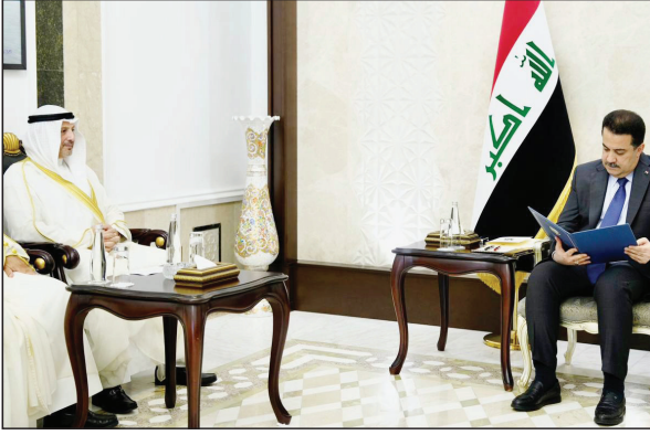
مع وزارة الخارجية كانت مثمرة، وعلاقتها متينة وقوية وسكنون أفضل ومستفهد إنجازات كبيرة...