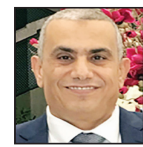
محمود حسونة كاتب مصري

فقد أصبح خير الطقس وأحواله عالمياً لا يقل أهمية عن الخير السياسي، بل هو خير سياسي يتم نشره في الصفحات الأولى أحيانا، ويصدر نشرات الأخبار أو يخلط مكانا متميزا بين أخبار الصدارة، وأصبح خبراء المناخ والناخ ضيوفا دائما في البرامج الصباحية و«الذوق شو» المسائي، والسبب أن المناخ تلى عن استقراؤه وأصبح شديد التطرف، وأحوال الطقس تجاوزت التوقعات. عانى معظم سكان نصف الكرة الشمالي، خلال الأسابيع الماضية، تجاوز درجات الحرارة للمألوف، وهي المعاناة التي لا يستطيع استمرارها خلال أغسطس المقبل، فالتطرف الحراري لم يعد يأتي على شكل موجات عابرة أيام محدودة، ولكنه يستمر أياما وأسابيع، وخلال الموجة المقبلة الأخيرة ظل الناس إما محاصرين داخل بيوتهم أو هارين إلى السواحل أو مسافرين إلى الخارج بحثا عن نسمة هواء