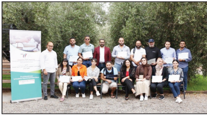
هذه الدورة تنطلق من ملاحظة وجود تناقض قوي بين الإطار القانوني، الذي يقدم مجموعة من الأحكام القانونية

والأخلاقية، وواقع الممارسة الصحفية بالمغرب التي يظهر العديد من الانتهاكات الأخلاقية والمهنية المتعلقة بالمبادئ الأساسية لحقوق الإنسان. وفي هذا السياق، أكد المصدر ذاته أن أهمية موضوع هذه الدورة مستمدة من ضرورة مراقبة الترسنة القانونية الموجهة للصحفيين والصحفيات، ليس «بتدريس»، ولكن أيضاً «بالتكوين» بالمفاهيم والأدوات الأساسية لحقوق الإنسان؛ ما يمكنهم من تطبيق القضايا المتعلقة بهذه الحقوق بشكل استباقي واحترافي، والبقاء على اطلاع دائم على الممارسات الفضلى في مجال التبرع الدولي، من أجل تعزيز صحافة مغربية أخلاقية ومهنية تحترم الضوابط الأساسية لحقوق الإنسان».