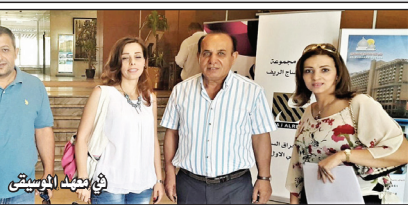
مع فريق العمل في فيلم ابن القف

قد عرض على العمل في مجلة محرر بعد عودتي للعراق لأي سبب في وان ارسلت المجلة ونشرت في موضوعين احدهم اخذ صورة الخلال فاعتذرت منه. لحد الان لم احترف العمل الصحفي واعتبر نفسي هاويا رغم اني الان رئيس تحرير لمجلة الكبريت عند شمسك السينمائي والصحفي والمنتج وكاتب في مجال السينما وموظف في شركة ابراهيمي ومنتج عددا اول.