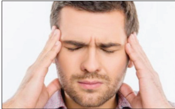
ومن السمات المميزة أيضاً ما يسمى بالأعراض الفرط زيادة السوائل في تجاويف الخنق الشوكي السحائية التي يسببها تهيج السحايا الناجم عن المعوية أو الجراحة.

المراهقون فقد يصابون بالشكل الحاد للمرض، مثل التهاب السحايا الفيروسي، ويتابع: «غالباً ما تكون إصابتهم حادة، ومصحوبة بحمى، وظهور ما يسمى بالعلامات السحائية، وأعراض محددة بما فيها المصاع الشديدة، والتقيؤ الذي لا يجلب الراحة، وفقدان الوعي، والتشنجات هي ممكنة أيضاً». ويوضح الطبيب إلى أنه عادة لا تختلف أعراض المرض عن التهابات الجهاز التنفسي الأخرى، حيث يمكن أن تستمر هذه الحالة لعدة أيام، كما هو الحال مع التهاب الجهاز التنفسي البادى أو العدوى المعوية. ويختتم: «ولكن، بالنسبة لالتهاب السحايا الفيروسي المعوي، فإن الأعراض العصبية، كقاعدة عامة، يصاحبها تكرر في ارتفاع درجة الحرارة بعد حوالي أسبوع من بداية المرض وبالإضافة إلى المصاع قد تظهر على خلفية الموجة الثانية لارتفاع درجة الحرارة وسوء الحالة الصحية العامة، علامات تلف الجهاز العصبي. مثل التقيؤ المتكرر، لذلك يتم إظهار هؤلاء المرضى إلى المستشفى في أقسام العدوى المعوية أو الجراحة.»