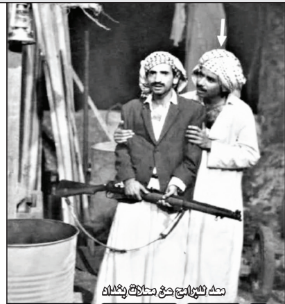
معلم وتلاميذ جمع حكايات بغداد

هؤلاء النقاد والشعراء الراحل علي الربيعي في ملحق ثقافة شعبية في جريدة الصباح عنوان : ( النمط الكلاسيكي قزارة في مجموعة) الشاعر جواد الرميثي (مخدوع). ويشكل عام اعطاء فكرة عامة عن مجموعتك (مخدوع) ؟