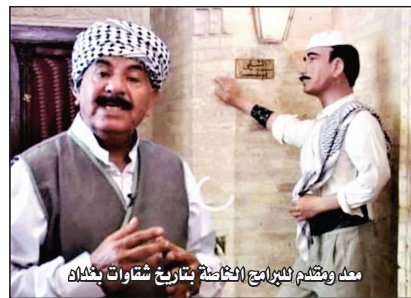
معلم وتلاميذ للبرامج (الخاصة بتاريخ شقاوات بغداد)