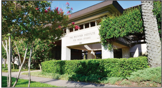
المحصله في لقاءات الصحفيات مترابطة بعضها ببعض.