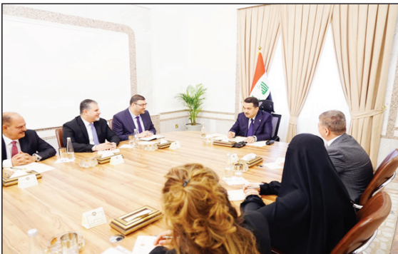
بغداد / الزوراء: وجه رئيس مجلس الوزراء، محمد شياع السوداني، هيأة الإعلام والاتصالات بضرورة التفاعل مع شكاوى المواطنين بشأن الخدمات والاستجابة لها من خلال الحلول السريعة للمشاكل. ومنع تكرارها، فيما أعلنت هيأة الإعلام والاتصالات كسب قرار قضائي لصالح الهيئة بات وملزم لشركة كورك تيليكوم بالاتصال بدفع 800 مليون دولار لخزينة الدولة العراقية.

والاتصالات على المؤيد في بيان: إنه متابعة جادة وحثيئة من رئيس مجلس الوزراء محمد شياع السوداني تمكنت الهيئة من حسم ملف النزاع القضائي مع شركة كورك تيليكوم، والإزامها بدفع ما يقرب من 800 مليون دولار لصالح الدولة العراقية كسب كسب لتراخيص الشركة وغيرها من المستحقات والمتعززة بدفعها منذ سنوات. وحذر، بحسب البيان، من أن الهيئة ستسجأ إلى اجراءات قانونية أخرى في حال تعثر الشركة بتطبيق القرارات القضائية أو عدم دفع الالتزامات المالية المترتبة بذمتها. وأوضح: أنه في الوقت الذي تشكر فيه الهيئة مجلس القضاء الأعلى الذي أضافها في حماية القانوني الذي يهدف إلى حماية حقوق المستخدمين، فإنها تؤكد استمرارها برصد أي ممارسات مخالفة عن قبل شركات الهاتف النقال التي تتعرض عن بنود الرخصة أو التي تتسبب في التسبب المستحقات المالية المترتبة بذمتها. وأشهر رئيس هيئة الإعلام إلى «أن استحصال هذا القرار يأتي في سياق حسم العديد من الملفات العديدة المترتبة منذ سنوات والتي تجري العمل على متابعتها من قبل الإدارة الجديدة للهيئة بالتنسيق مع مجلس المفوضين وبدعم وبإشراف مباشر من رئيس الوزراء محمد شياع السوداني».