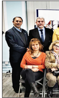
اقامها الشيخ العراقي والتلفزيوني

يوضح في كل ماكتبته ، في الشعر والنثر وكل كلمة اقولها، حتى الآن تجد روح القرية وروح الريف، الروح الطين والعشب واصوات الناس والطيور والمناخية والفضاء الفطري والعذب وطقس الحزن والفقر والغيبيات المثيرة ممتزجا باي تجربة