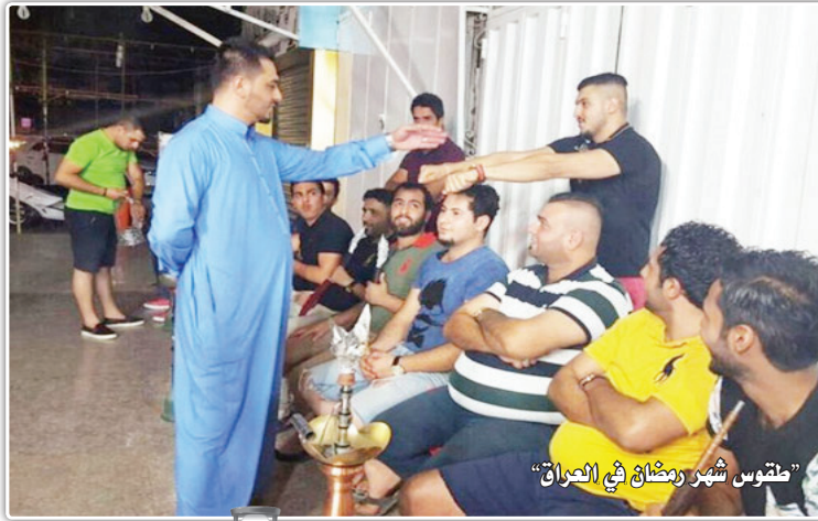
"طقوس شهر رمضان في العراق"