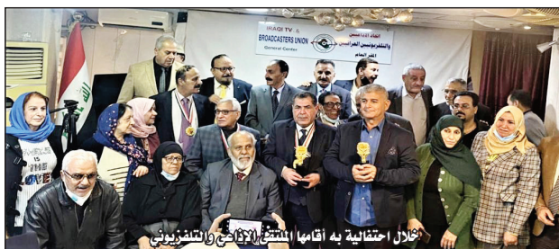
تحال احتفالية به اقامها الشيخ العراقي والتلفزيوني

جديدة في الحياة ، لذلك ترى الناصرية وسوق الشيوخ وغليون ومشاهد الصيد والحياة والموت ووجوده النساء الحزبات ثم العراق المركب الكبير متداخلا تماما مع مارييت من مدن نسيب زرتها أو عشت فيها، الكتابة بالعبودية في صوت داخلي على تلك الاقاعات السحرية ، كل شيء يخرج الى الورقة والكتاب إلا منقوعا بماء الحياة ذلك المائي بكل اضطرابه وتناقضاته هي قوة تحركني دائما. كيف نمت تجربتك الشعرية في الناصرية ؟ كانت قراءاتي العامة متنوعة وقضوي شديدا مدعوماً من أصدقاء