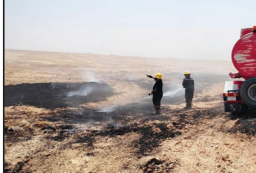
داخلي بكل مهنية وبوقت قياسي قصر وتحد من توسعها وانتشارها بأقل الخسائر للمدينة وسعدنا اي اضرار بشرية»

موصول الحنطة من الحقول المجاور وبدون اي اضرار بشرية» وفي بيان شان، أشارت المديرية إلى أن مفارزها «في الهنديه بكريلاء انقذت فتاة كادت أن تصلبها النيران وأخمدت حادث حريق اندلع بدار سكني في منطقة نهر السلام بقضاء الهندية بسبب تصاس كهربائتي داخلي وسيطرت على النيران المتدلاة بكل مهنية وبوقت قياسي قصر بعد اخراج الفتاة من داخل الدار وحد توسعها وانتشارها وبدون اي اضرار بشرية» وتابعت أن مفارزها «في مركز طوزخورماتو بمحافظة صلاح الدين