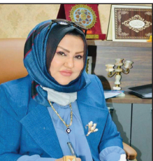
ملايين نسمة» وأوضحت أن «تعزيز الحلول التي اتخذت لسحب الزخم السكاني داخل العاصمة

إلى مناطق الأطراف، استحداث مدينتين عصريتين الأولى مدينة علي الوردى في منطقة الهضرون والثانية مدينة الطارق في أبو غريب بواقع أكثر من ٢٠٠ ألف وحدة سكنية»