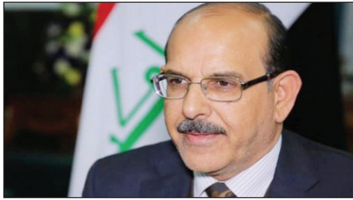
اللواء يحيى رسول، كشف الخسيس الماضي عن تفاصيل جديدة تخص الخدمة الإلزامية.

وأوضح رسول إن «راتب المجند سيكون من ٧٠٠ ألف دينار إلى ٧٥٠ ألفاً وبيداً سن التجنيد من ١٩ ميبتان» «مدة التجنيد تختلف عن شهادة المجند ولكن ليس بالبطريقة السابقة وربما تكون أقل لحمة الشهادات» ولفت إلى أن «أعلى مدة خدمة تصل إلى ستة وسبكون ثم شارك في الخدمة الإلزامية في التجنيد والوظائف ولدينا تعامل آخر بالموضوع وربما يخدم لأشهر قليلة» وأكد رسول «لدينا معسكرات جيدة وكافية ونعمل على بناء أخرى ومتكاملة وقدمت صانح ودراسات بشأنها إلى القائد العام للقوات المسلحة» وكشف عن مفاجأة «خطيرة» عن أعمار المؤسسة العسكرية التي وصلت إلى «الشيخوخة» وتلثين سنجرى كتهول وتعمل بثلث فقط ونحتاج إلى فتح باب التطوع بـ ١٠ آلاف درجة وظيفية والمشكلة في التخصيصات المالية»