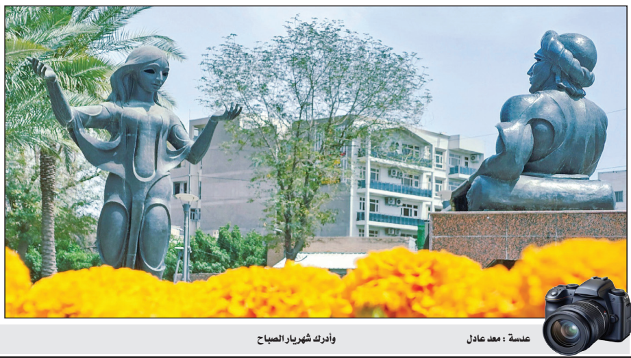
وأدرك شهريار الصباح

١٢٥٠ - انهزام الصليبيين في المنصورة بمصر خلال الحملة الصليبية السابعة، وأسر ملك فرنسا لويس التاسع. ١٨١٤ - نفي الإمبراطور الفرنسي نابليون بونابرت إلى جزيرة إلبا في البحر الأبيض المتوسط. ١٨٩٠ - القوات الفرنسية تغزو غرب السودان وتحتل بلدة «سجوة». ١٨٩٦ - افتتاح أول دورة ألعاب أولمبية في أثينا. ١٩٠٩ - المكتشف الأمريكي روبرت بيري يصل إلى القطب الجنوبي. ١٩١٧ - الولايات المتحدة تدخل الحرب خلال الحرب العالمية الأولى. ١٩١٩ - بدء ثورة مهاتما غاندي في الهند. ١٩٨٥ - الإطاحة بالمشير جعفر نمري بعد اضطرابات دامت لعدة أيام في الجزائر. ١٩٩٢ - دول المجموعة الأوروبية تعترف باستقلال البوسنة والهرسك. ١٩٩٤ - بداية الحرب العرقية في رواندا عندما أقدم متطرفون على إسقاط طائرة كانت تقل أول رئيسان لرواندا ويورودي من أغلبية الهوتو. ١٩٩٨ - باكستان تجرب صاروخ متوسط المدى قادر على الوصول إلى الأراضي الهندية.