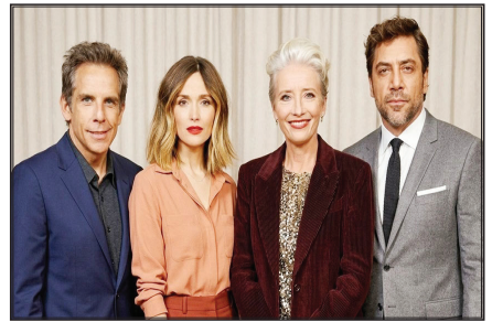
الجمعة، 2026/4/15 الساعة 7:30 مساءً

الاعلامية وتقلص من فرص المنافسة التي لا تستطيع فيه الصناعة ولا الجمهور تحمل المزيد من الانتماءات كما تقدر قيمتها بنحو مئة وأحد عشر مليار دولار قد تؤدي إلى تقليص عدد استوديوهات الأفلام الكبرى في الولايات المتحدة إلى أربعة فقط وهو ما يعني فرصاً أقل للمبدعين وتراجيحاً في الوظائف وتضييقاً في خيارات الجمهور. وانضم إلى قائمة المعارضين عدد آخر من النجوم من بينهم كريستين ستيوارت وغلين كلوز الذين أكدوا رفضهم لهذا التوجه الذي يروونه تهديداً مباشراً لتنوع الإنتاج الفني واستقلالية الإبداع في هوليوود.