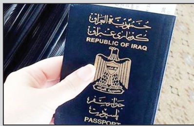
لجنة عليا لتحسين تصنيف الجواز العراقي ورفع قيود السفر