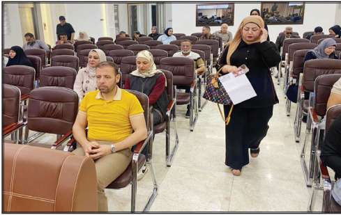
محافظةهم لإكمال إجراءات تجديد هوياتهم وفقا للضوابط والتعليمات المعتمدة.. وأجابت النقابة بالصحفيين التعاون معها بهدف تسهيل إجراءات تجديد الهويات.

الصحفيين الرواد، وفي ما يخص رفع ترقين القيود فتمتثل للضوابط المذكورة أعلاه. ويشأن الصحفيين في المحافظات، أوضح البيان: أن «عليهم مراجعة فروع النقابة في