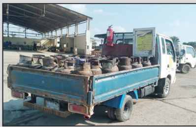
تظاهرة لوكلاء الغاز: يسقط الكوبون الإلكتروني