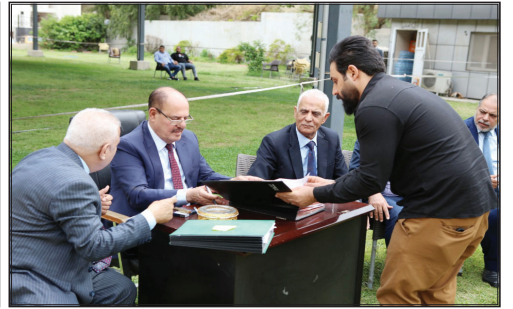
بغداد/ الزوراء

وتقول نقابة الصحفيين العراقيين، السبت ٢٠٢٦/٤/٤، تجديد هويات الصحفيين