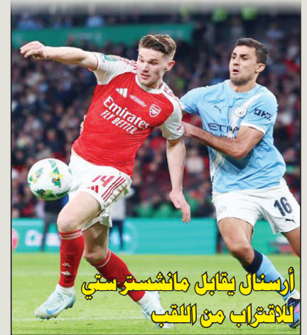
أرسنال يتقابل مانشستر سيتي للالتحاق من اللقب