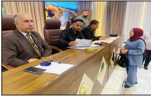
لهذا الغرض، على أن ترفق بكتاب تأييد من المؤسسة الإعلامية التي يعمل فيها الصحفيين من سكنة محافظة بغداد لغرض تسهيل الإجراءات، حسب الاستمارة المعدة

الصحفيين الرواد، وفي ما يخص رفع ترقين القيود فتمتثل للضوابط المذكورة أعلاه. ويشأن الصحفيين في المحافظات، أوضح البيان: أن «عليهم مراجعة فروع النقابة في