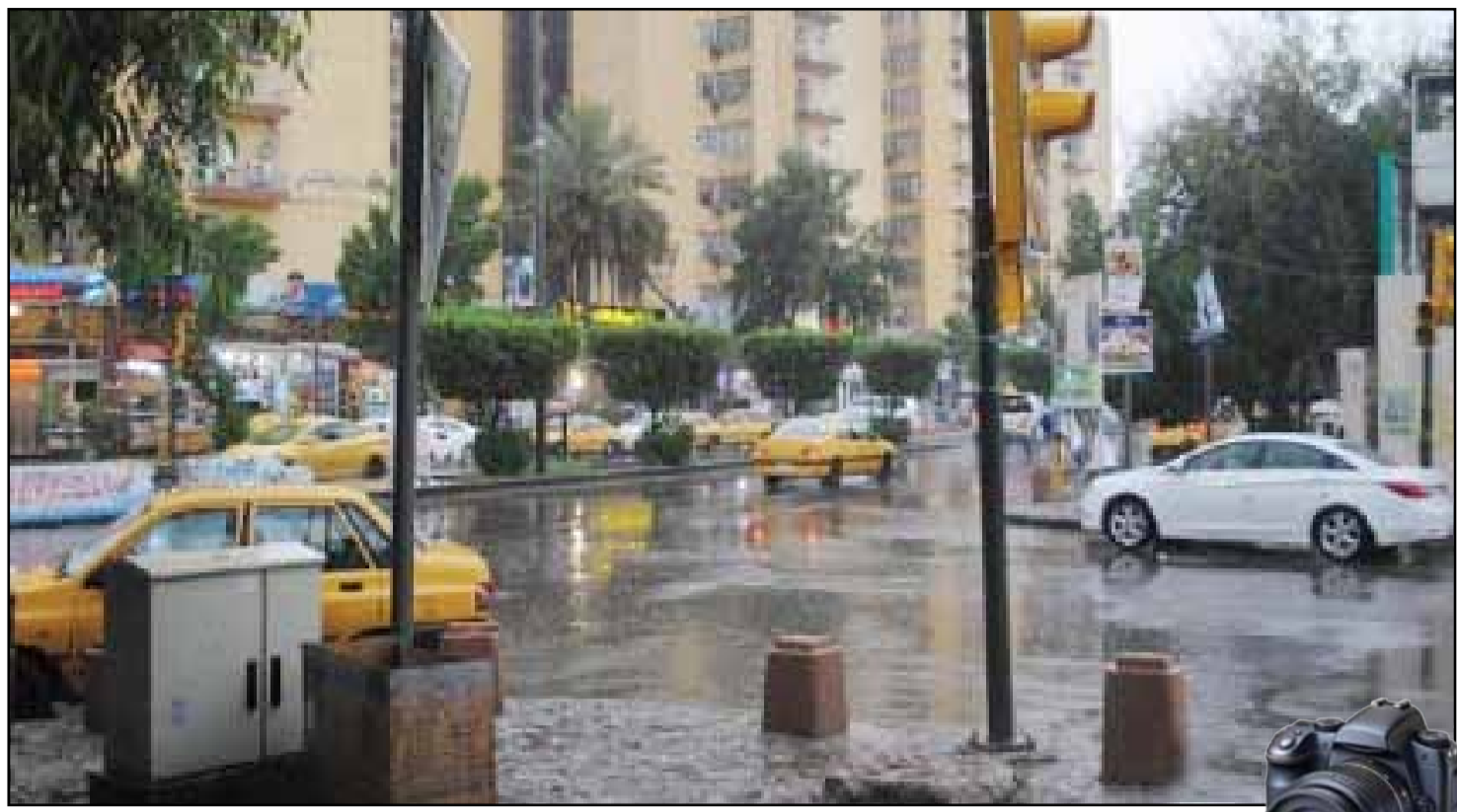
أمطار غزيرة تنعش أجواء العراق

١٤٠١ - شاه مغول الأتراك تيمورلنك يغزو دمشق. ١٦٠٣ - جيمس السادس ملك اسكتلندا يصبح جيمس الأول ملك إنجلترا بعد وفاة إليزابيث الأولى ملكة إنجلترا. ١٦٦٣ - تم منح مقاطعة كارولينا بموجب ميثاق إلى ثمانية لوردات كمكافأة على مساعدتهم في استعادة تشارلز الثاني ملك إنجلترا إلى عرشه. ١٧٢١ - قام يوهان سباستيان باخ بتخصيص ستة كونشرتوهات لصالح المارغريف كريستيان لودفيغ من براندنبورغ - شفيت، والتي تُعرف الآن عمومًا باسم كونشرتو براندنبورغ. ١٨٣٧ - كندا تمنح مواطنيها الأفارقة حق التصويت. ١٨٨٢ - المكتشف الألماني روبرت كوخ يكتشف الميكروب المسبب لمرض السل. ١٩٠٧ - الجيش الفرنسي بقيادة الجنرال ليوطي يدخل إلى مدينة وجدة في المغرب. ١٩٢٣ - قيام النظام الجمهوري في اليونان. ١٩٨٥ - وقوع انفجار في صلاة الجمعة طهران أثناء خطبة علي خامنئي، ما أسفر عن مقتل ١٤ شخصًا وجرح ٨٨. ١٩٨٩ - غرق ناقلة النفط «إكسون فالديز» قرب سواحل ألاسكا مما أدى تسرب ٤٠٠٠ طن من النفط الخام على طول ١٧٠٠ كم من السواحل ووقوع كارثة بيئية.