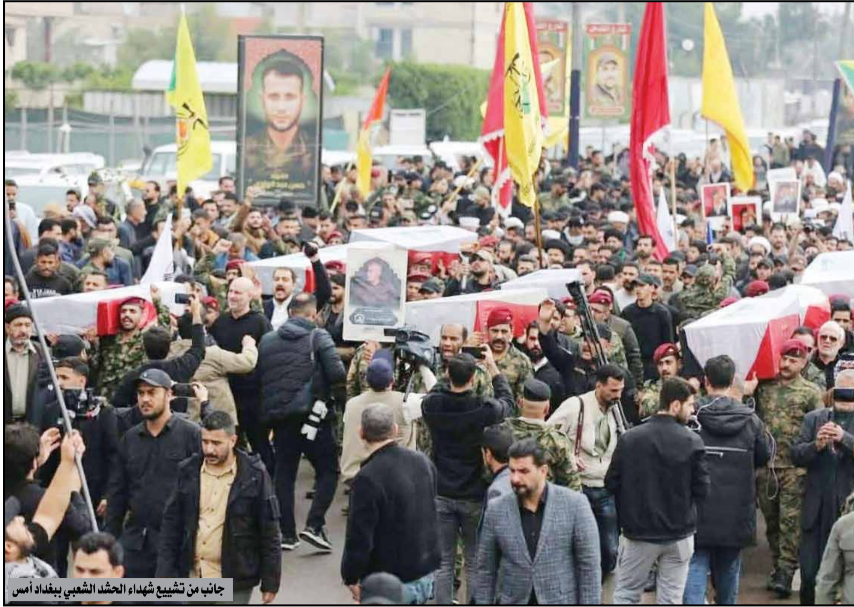
جانب من تشييع شهداء الحشد الشعبي ببغداد أمس

تنفيذ أوامر القبض على منفذي الهجمات على مؤسسات الدولة