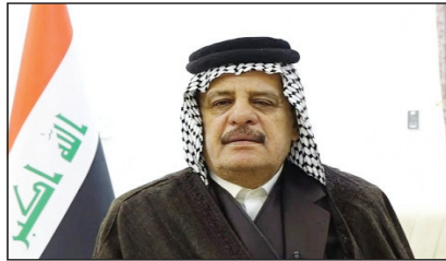
التفريط بحقوق العراق المائية في نهر دجلة والفرات ومجاملة الجانب التركي. وانتقد الجبوري الاتفاق الأخير

الواقعة على ضفافهما. وأشار إلى أن «ارتفاع مناسيب المياه كان سابقاً بخفض من آثار التلوث، لكن تراجع الإطلاقات أدى إلى شرب المواطنين مياه ملوثة في عدد من المحافظات، محذراً من أن «قلة المياه يخلق أضراراً بيئية وصحية ومجتمعية وقد يتسبب بنزاعات بين المحافظات وقد تمتد آثارها إلى داخل العائلة الواحدة».