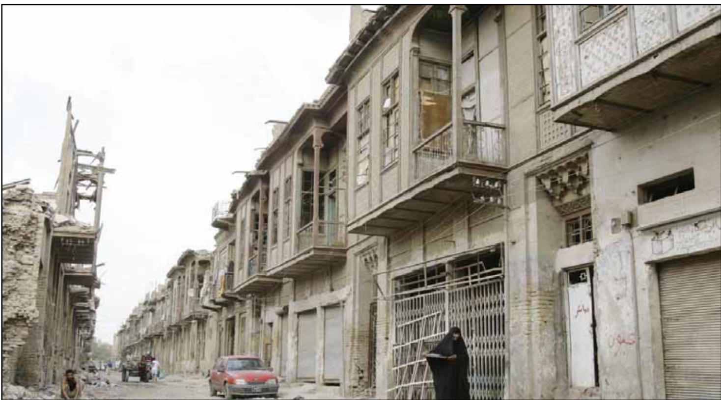
أحد الأزقة القديمة في بغداد

١٤٧٩ - توقيع معاهدة بين الدولة العثمانية وجمهورية البندقية القوة التجارية الكبرى في أوروبا، وكانت تلك المعاهدة أول خطوة خطتها الدولة العثمانية للعب دور سياسي في أوروبا. ١٧٨٨ - بريطانيا تنشئ أول مستعمرة مجرمين في «بوتاني باي» بأستراليا. ١٨٤٦ - انتصار القوات البريطانية على السيخ في «معركة البيوال» بالهند. ١٨٧١ - انتهاء الحرب الفرنسية البروسية باستسلام فرنسا. ١٨٨٧ - بداية بناء برج إيفل. ١٩٠٩ - جلاء القوات الأمريكية عن كوبا التي احتلتها خلال الحرب الأمريكية الإسبانية عام ١٨٩٨. ١٩١٧ - الولايات المتحدة تنهي البحث عن الناصر المكسيكي بانتشو فيا. ١٩١٨ - تأسيس الجيش الأحمر الذي ضم في صفوفه جنود من الجيش الروسي القيصري السابق، وكان هدف تأسيسه هو حماية الحدود من الغزو الخارجي وحماية الثورة. ١٩٢٠ - أسس خوسي ميلان أستراي الفيلق الإسباني. ١٩٢٤ - سعد زغلول يؤلف أول وزارة شعبية في مصر. ١٩٢٨ - وقوع معركة الرقعي بين القوات الكويتية بقيادة الشيخ علي الخليفة عبد الله الصباح وجماعة من الإخوان بقيادة علي بن عشان.