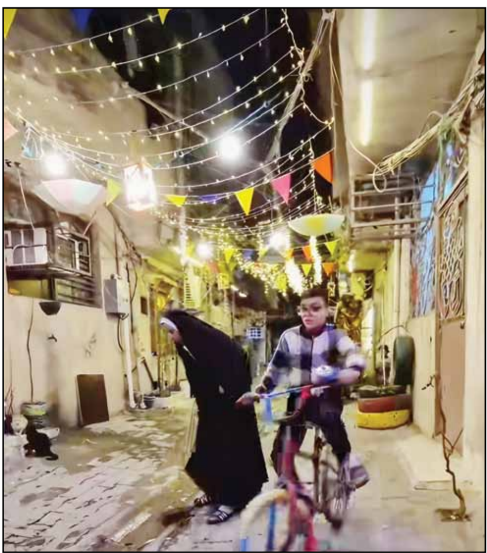
زقاق بغداد يبتزين بالاضواء ابتهاجاً بشهر رمضان المبارك

من المراحل الثلاث لحرق الغاز في الحقول الكثيرة المتوفرة في العراق. وجاء في البيان الصادر عن المكتب الاعلامي لرئيس مجلس الوزراء، تلقته "الزوراء": أن "رئيس مجلس الوزراء، محمد شياع السوداني، ترأس اجتماعاً لفريق قطاع الكهرباء، خصص لمناقشة الإجراءات المتخذة لتنفيذ خطة صيف 2025، وإجراءات الجباية والتحول الإلكتروني في جميع