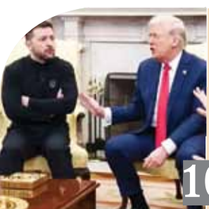
زيلينسكي الرئيس المهن