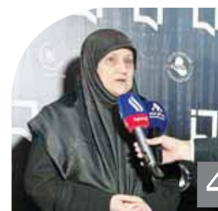
توقيع عقد عالمي جديد في مجال الترانزيت