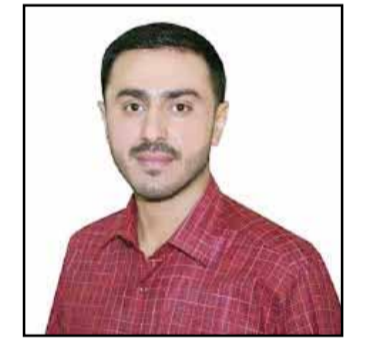
سيف صلاح الهييتي

مرة: واشنطن لم تعد مستعدة لتمويل حربه إلى ما لا نهاية، ولا لإنقاذه دون تنازلات قاسية. خلال الاجتماع، الذي وصفته وسائل الإعلام بأنه «الأكثر إذلالاً لرئيس أجنيبي داخل البيت الأبيض»، تعرض زيلنسكي لضغوط شديدة، خصوصا فيما يتعلق بوقف الحرب مع روسيا وتوقيع اتفاق المعادن، الذي يمنح الشركات الأمريكية امتيازات واسعة في استخراج الموارد الأوكرانية. ترامب لم يكتف بالضغط، بل أنهى اللقاء بطرد زيلنسكي من البيت الأبيض، قائلا له بلهجة حادة إنه لن يكون مرحباً به مجدداً إلا إذا جاء مستعداً للسلم. إهانة بهذا المستوى لم يتعرض لها أي رئيس دولة سابقاً. ضيق الخيارات وسقوط الوعودات، زيلنسكي، الذي لم يملك أي أوراق ضغط حقيقية، حاول التمسك بفكرة الضمانات الأمنية الأمريكية بل وطالب بإرسال قوات أمريكية لحماية أوكرانيا، لكن الرد الأمريكي كان واضحاً: لا مزيد من التورط المباشر، وأي دعم مستقبلي مشروط بالتفاوض مع موسكو وفق الشروط الأمريكية. ما زاد الطين بلة، أن زيلنسكي لم يجد أي دعم حقيقي في أوروبا أيضاً، فقبل لقائه بترامب، كان رئيس الوزراء