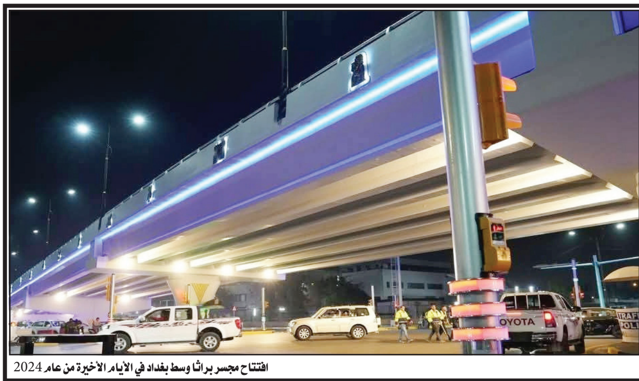
افتتاح جسر برأثاً وسط بغداد في الأيام الأخيرة من عام 2024