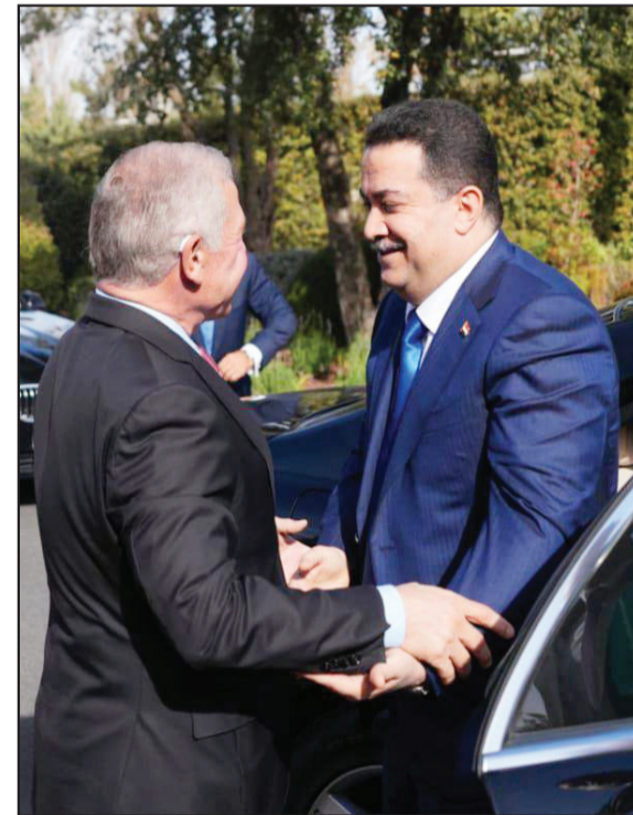
السوداني والملك عبد الله في عمان صباح أمس

بغداد / الزوراء أعلنت وزارة البيئة، عن انخفاض نسبة التلوث في الهواء، مبيّنة أن ذلك جاء بعد عدة إجراءات حكومية وتوجيهات من رئيس الوزراء. وقال المتحدث الرسمي للوزارة، لؤي المختار، في تصريح صحفي: إن "نسب تلوث الهواء الحالية تُعد متوسطة، ونوعية الهواء جيدة إلى حد ما ولا تشكل خطراً كبيراً". وأضاف، أن "نوعية الهواء ليست ثابتة، فهي متغيرة في أوقات معينة، وقد تشهد تراجعاً طفيفاً في بعض الساعات، لكن بشكل عام فإن حالات التراجع تكون محدودة ولا تستمر سوى لأيام قليلة". وأشار، إلى أن "هناك تحسناً ملحوظاً في