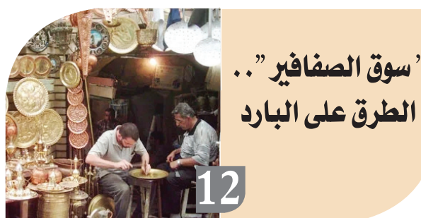
”سوق الصفاير“.. الطرق على البارد

أكدت خلية الإعلام الأمني أن القوات الامنية بمختلف صنوفها تشهد تطوراً كبيراً في قدراتها، لافتة إلى ان هذا التطور انعكس على تأمين الحدود العراقية المشتركة مع دول الجوار وبشكل كامل. وقال رئيس الخلية اللواء الطيار حسين الخفاجي في حديث لـ«الزوراء»: ان القوات الامنية العراقية حققت تقدماً كبيراً في تأمين الحدود، خاصة في قطاعي عمليات ينوي وغربها، وقاطع الحدود الذي تغطيه قيادة قوات الحدود الثانية والجيش العراقي. لافتاً إلى: ان الحدود مع سوريا بعدما كانت في السابق تشهد تسلسلاً وخروقات اليوم أصبحت مؤمنة