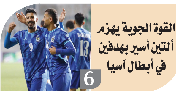
القوة الجوية يهزم ألتين أسير بهدفين في أبطال آسيا