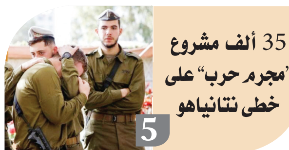
35 ألف مشروع ”مجرم حرب“ على خطى نتانياهوه