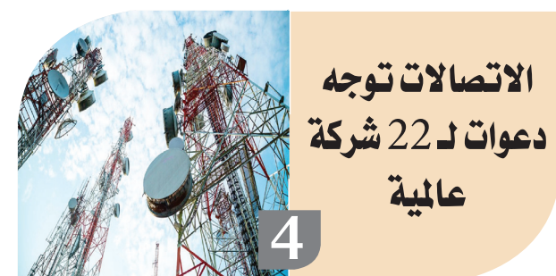
الاتصالات توجه دعوات لـ22 شركة عالمية