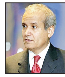
عبد الرحمن الراشد كاتب وإعلامي سعودي

مسألة المهاجرين غير الشرعيين، ترمب حولها إلى أهم قضية وجعل أمن الحدود وعده الأول. وهو يعد بزيادة شرطة الحدود، والإنفاذ الصارم لتحريك ملايين المهاجرين غير الشرعيين «حماية للسيادة الأمريكية».