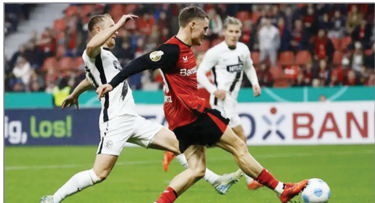
الفرنسي 1-1 في دوري أبطال أوروبا وفيردر بريمن 2-2 في الدوري، عاد فريق المدرب الإسباني تشابي ألونسو إلى سكة

واصل باير ليفركوزن حملة الدفاع عن لقبه بنجاح، وبلغ ثمن نهائي مسابقة كأس ألمانيا، من دون عناء، وذلك بفوزه على ضيفه الفرسبورج من الدرجة الثانية بالفوز عليه 3-0. وحسم ليفركوزن الذي أحرز الموسم الماضي لقب الدوري أيضاً للمرة الأولى في تاريخه إضافة لوصوله إلى نهائي مسابقة «يوروبا ليغ» حيث منى بهزيمته الوحيدة للموسم على يد أتالانتا الإيطالي (3-0). سجلت فيه الأهداف الثلاثة.