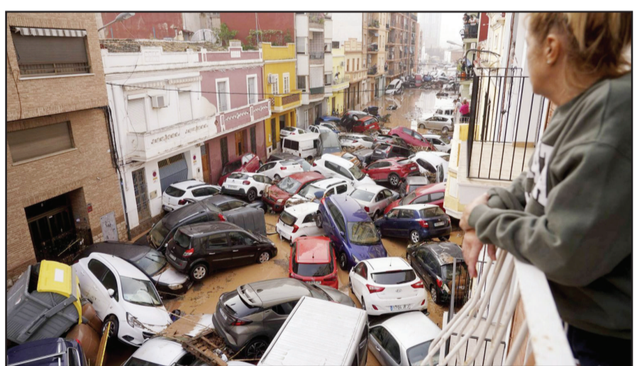
جاء الفيضانات الواسعة التي اجتاحت جنوبي البلاد العارمة

إلى 63 شخصاً على الأقل. وأكدت خدمات الطوارئ في منطقة فالنسيا الشرقية حصيلة القتلى 62 شخصاً، وأضاف المكتب المركزي للحكومة لمنطقة كاستيليا لا مانشا أنه تم العثور على امرأة تبلغ من العمر 88 عاماً ميتة في مدينة كوينكا، حسب وكالة "أسوشيتد برس". وتسببت العواصف الممطرة، في حدوث فيضانات في مساحة واسعة من جنوب وشرق إسبانيا، تمتد من ملقة إلى فالنسيا. وتسببت فيضانات المياه في انقلاب المركبات في الشوارع، بينما عامت قطع الخشب في الماء مع الأدوات المنزلية.