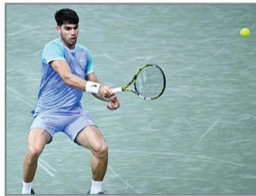
أمام نفس اللاعب في نصف نهائي بطولة بونينوس أيرس في فبراير/ شباط الماضي، يانوفيتز.

استهل النجم الإسباني الشاب كارلوس ألكاراز، المرشح الثاني للقب، مسيرته في بطولة باريس المفتوحة لتتس الأساندة، ذات الـ 1000 نقطة، بفوزه في الدور الثاني على التشيلي نيكولاس جاري بمجموعتين دون درد. احتاج المصنف الثاني عالمياً لساعة ونصف من أجل حسم اللقاء لصالحه بنتيجة 5-7 و1-6.