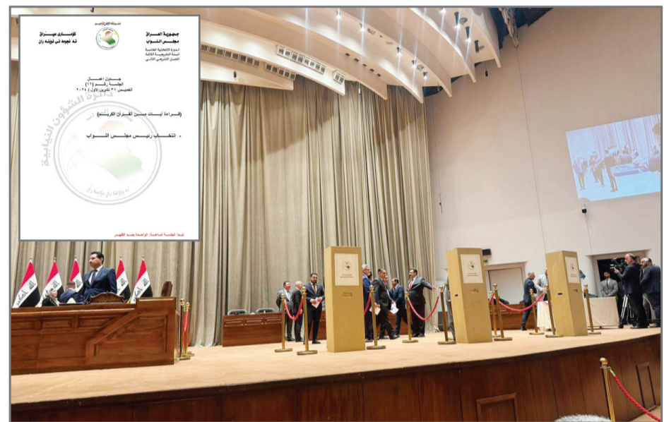
الجلسة السابقة لانتخاب رئيس البرلمان .. من الأرشيف - ووثيقة جدول أعمال اليوم

بغداد/ الزوراء: يتجه مجلس النواب، اليوم الخميس، لانتخاب رئيس له وحسم مخاض عسر دام لنحو 11 شهراً، بسبب الخلافات السياسية حول مرشحي المنصب، وفيما كشفت مصادر سياسية عن أن النائب محمود المشهداني هو المرشح الأبرز لنيل ثقة البرلمان، وفي سياق آخر وجه