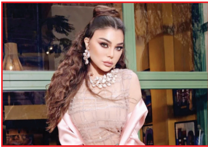
أعربت الفنانة اللبنانية هيفاء وهبي، تجاه العدوان الذي يتعرض له لبنان عن استيائها من الصمت الدولي خلال الفترة الحالية. ونشرت هيفاء

وهبي عبر صفحتها الشخصية على انستغرام، مقطع فيديو على شكل رسالة نصية من لبنان يطلب فيها البلد المساعدة، ليأتي الرد بالصمت التام من العالم. وأرقت وهبي الفيديو بالتعليق التالي: «صمتهم أشد قسوة من أي حرب... يئنّ وطني من الألم ودماء أبنائه ستبقى جزءاً من ذاكرة مؤلمة في شوارعها التي كانت يوماً مليئة بالحياة... يا رب تتلطف بلبنان والبلبانيين». يذكر أنّ هيفاء وهبي أصدرت مؤخراً أغنية «يا نحلة» من كلمات مصطفى حسن، أحيان بلال سرور، توزيع وفواصل الشعبي المعارض لها والمطالب برحيلها وبمحاسبة رئيسها قضائياً. موسيقى هاني ربيع، وطرحتها هيفاء وهبي في فيديو بالكلمات.