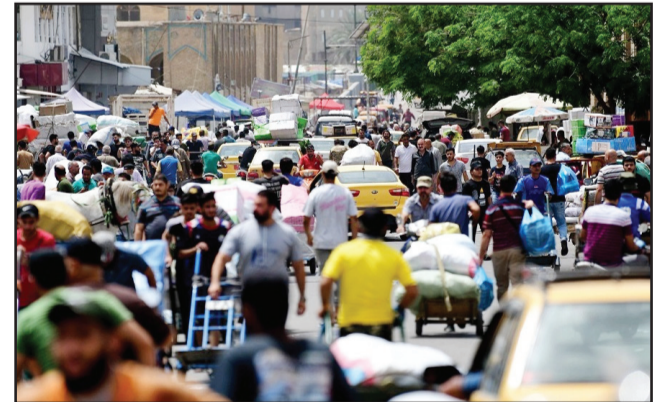
بغداد/ متابعة الزوراء: