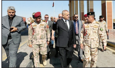
بغداد / الزوراء: أصدر مدير عام الشركة العامة لموانئ العراق فرحان الفروسي، توجيهات لإدارة ميناء أم قصر.

بغداد / الزوراء: أصدر مدير عام الشركة العامة لموانئ العراق فرحان الفروسي، توجيهات لإدارة ميناء أم قصر. وقال الفروسي في بيان تلقت «الزوراء»: «أجرينا اليوم برفقة قيادة القوات البحرية والمدونة الدولية جولة ميدانية في ميناء أم قصر». وأضاف أنه «تم الاطلاع على الإجراءات الأمنية المتبعة في شحن وتفريغ البضائع»، موجهاً «بالتأكيد على تشديد الإجراءات تحسباً لأي طارئ». وتابع «اطلعنا على حركة دخول وخروج الشاحنات إلى ساحات الميناء وحركة نقل البضائع وعدد من المشاريع التطويرية». الجدير بالذكر أن العراق وعبر الشركة العامة لموانئ العراق يمتلك (٥) موانئ، أحدها تخصصي في المشتقات النفطية، كما أن هناك ميناء آخر قيد الإنشاء (ميناء الفاو الكبير) والذي من المتوقع يكون واحداً من أكبر عشر موانئ في العالم، حيث يشهد نسب إنجاز متقدمة، كما أن حركة البضائع ومناولة الحاويات قد شهدت ارتفاعاً كبيراً خلال الأربع سنوات الماضية.