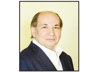
د. خالد قنديل عضو مجلس الشيوخ المصري

يبود أن وجود كيان باسم «إسرائيل»، بات مرهوناً ببقاء قبيل الصراع مشتعلا، وليس مهماً على أي مستوى من الاشتعال، حتى إذا خفت حدة اللهب، وسعى الوسطاء المنخرطون في محاولات جادة للتهدئة والوقف التام للحرب، يتم التفخ في كتلة اللهب لتكبر وتمتد نحو سباقات أخرى تلتهم فيها الأخضر واليابس، وهذا ما تابعناه من بعد أكثر من ٣٥٠ يوماً من الحرب المستمرة على قطاع غزة وامتداد القتال إلى الضفة الغربية، صارت الجبهة اللبنانية بوضوح في مرمى النيران. الصراع في لبنان يزداد اشتعالا يوما بعد آخر، حتى الوصول إلى أحداث تلك التفجيرات الإلكترونية في أجهزة «بيجر»، تلك الهجمات التي هزت المنطقة، أو بالأحرى زادت أوجاعها القائمة جراء الحرب الشرسية والوحشية في الأراضي الفلسطينية، لتحث خطوة التفجيرات في أجهزة الاتصال، التي يستخدمها عناصر حزب الله يومي الثلاثاء والأربعاء