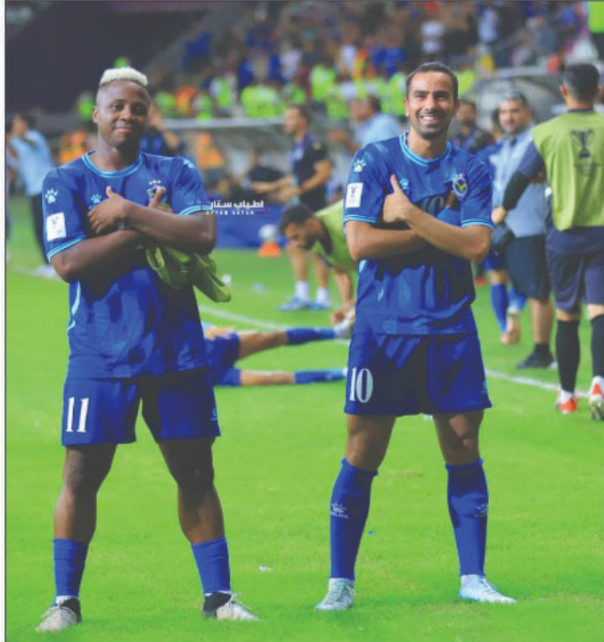
تسجيل هدفين متتاليين في أول 15 دقيقة، قبل أن يختم أهدافه في نهاية الشوط الأول بالهدف الثالث الذي حسم به اموره تماما. وجاءت المباراة متوسطة المستوى، بدأها الفريق الإيراني بمتهمتي القوة ونجح في