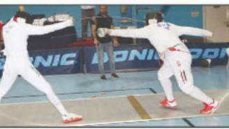
بطولة ستليات العالمية، تجري بتتظيم الاتحاد العراقي للمبارزة، وبإشراف ومتابعة إتحادي غرب