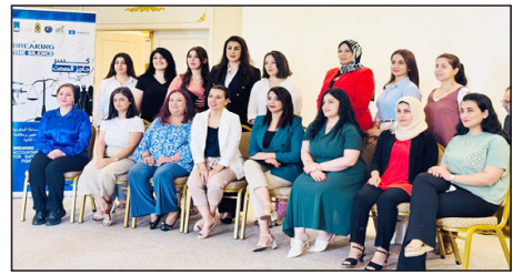
بغداد / نينا.

شهدت فعاليات دورة التدريب المكثفة التي نفذها مكتب العراق لمنظمة الأمم المتحدة للتربية والعلم والثقافة «يونسكو» في محافظة السليمانية، حضوراً فاعلاً للصحفيات من إقليم كردستان 25 صحفية من أصل أكثر من 30 مشاركة «تلقتوا تدريبات على آليات السلامة والحماية للصحفيات العاملات في بيئات عالية الخطورة».