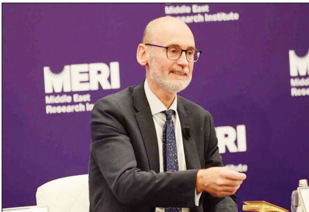
Middle East Research Institute