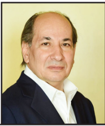
د. خالد قنديل عضو مجلس الشيوخ المصري

في ظل تواطؤ دولي وعجز أممي واضحين، أمام ما يحدث - بإعادة - بالمعنى الأوضح والأشمل للكلمة - يشهدها قطاع غزة منذ أكثر من عشرة أشهر كاملة ومتواصلة، يفتح الكيان المحتل جبهة جديدة للحرب بالضفة الغربية، وأيضاً أمام مرأى ومسمع من العالم كله شعوباً وحكومات ومنظمات أممية، وقد صرح وزير دفاع الاحتلال يوآف جالانت بشكل عادي، بأنه التقى كبار القادة العسكريين قريباً من جنين؛ لمعرفة الجديد حول عملية عسكرية تجري الآن بالضفة الغربية المحتلة.