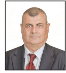
أ.د. جاسم يونس الحريري كاتب عراقي بروفيشور العلوم السياسية

السفير البريطاني في العراق ((ستيفن تشارلز هيتشن)) عين خلفا للسيد ((مارك إدوارد برايسون- ريتشاردسون)) السفير البريطاني السابق وهو دبلوماسي بريطاني، يقترّب عمره من العقد السادس. وُلد في ((هاروغيت)) بالمملكة المتحدة، وهو نجل محام وواعظ علماني من الطائفة المسيحية البروتستانتية، وكان تلميذاً في مدرسة ((سانت بيتر)) الابتدائية وكلية ((أشفيل)). وبعد التخرج التحق هيتشن بالخدمة المدنية وعمل في وزارة الدفاع ثمانية سنوات وتعلم خلالها اللغة العربية في دورة تدريبية تلقاها هناك خلال مدة ١٨ شهراً من التدريب.