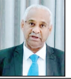
فيصل محمد صالح وزير الإعلام السوداني السابق

شخصية ولا قراءة فنان، بل بجميع معلومات وحوارات، ثم قراءة حقيقية للواقع الميداني ومآلاته.