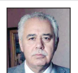
عبد الحسين شعبان كاتب ومفكر عراقي

بفعل ظواهر عديدة سلبية وإيجابية. فالأولى اتسمت بنوع جديد من التعصب ووليدته التطرف، وخصوصاً في مجتمعاتنا، وكان من نتاجها استفحال العنف والإرهاب بكل صنفهما وأشكالهما الفردي والجماعي، المجتمعي والحكومي، المحلي والدولي، وشمل الأمر المجتمعات المتقدمة في الغرب والبلدان النامية على حد سواء، ومنها بلادنا العربية، حيث شهد الغرب شعوبية وعنصرية وكرهاية للأجانب لدرجة العداوة، ولاسيما ضد العرب والمسلمين، لم تكن معروفة في السابق، وبالقيض من القيم الإنسانية التي يبشر بها، كما شهدت مجتمعاتنا طائفية سياسية منفلتة من عقالها، إضافة إلى شحن وتمترس في الهويات لدرجة الاحتراب، وبسبب عدم التسامح اندلعت نزاعات مسلحة أدت إلى تفكك مجتمعاتنا وتذوّر الوحدة الوطنية، التي قامت عليها الدولة المحاصرة في مجتمعاتنا. أما الثانية، فقد أصبح صدور إعلان مبادئ التسامح والاحتفال العالمي