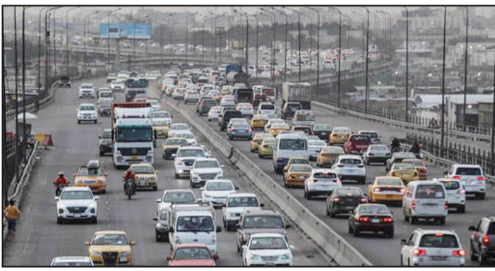
بغداد/ الزوراء: شوارع بغداد، فيما أشارت الى إعداد أعلنت مديرية المرور العامة تقديم مقترحات لتخفيف الزخم المروري في الدراسة لمعالجة أعداد المركبات والطاقة الاستيعابية لطرق العاصمة.

وأوضح أن «مديرية المرور قدمت مقترحات عديدة تضمنت العودة الى نظام ترقيع قيد المركبات القديمة، بالإضافة الى وضع آليات أخرى في استيراد المركبات»، معرباً عن أمله «بنقل بعض المناطق التجارية وكذلك الصناعية وبعض الوزارات الى الأطراف خارج بغداد، من أجل تخفيف الزخم الموجود داخل العاصمة».