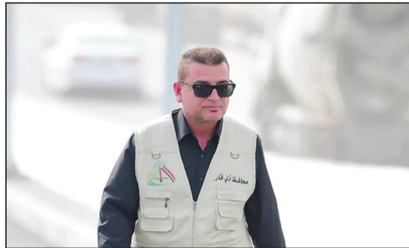
بغداد/ الزوراء: ألقى محافظ ذي قار مرتضى عبود الإبراهيمي حزمة من المشاريع الخدمية الجديدة في مناطق مركز مدينة الناصرية. وتضمنت قائمة المشاريع وفقاً لبيان لمكتب المحافظ تلقت «الزوراء» نسخة منه، ما يلي:

- مشروع انشاء وشوارع في مناطق (سومر ٢ و١) وحي ام البنين وشوارع متفرقة في مدينة الصدر وشوارع الشهداء.