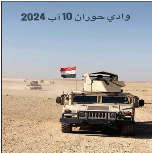
بغداد/ الزوراء: نفت خلية الإعلام الأمني الأنباء التي تتحدث حول صعوبة القوات الأمنية من الوصول إلى مناطق في وادي حوران بصحراء الأنبار. وذكرت الخلية في بيان تلحقته «الزوراء» أنه «بين الحين والآخر يحاول بعض المغرضين الترويج الى قضايا وموضوعات لا أساس لها من الصحة، كان آخرها (أن هناك تواجداً لأعداد كبيرة من عناصر عصابات داعش الإرهابية في المناطق التي يصعب الوصول إليها في وادي حوران بصحراء الأنبار)، وحسب ما يتصور من يعمد الى نشر او طرح هكذا محتويات في بعض مواقع التواصل الاجتماعي».

وأضافت أنه «نود ان ننوه أن قطاعنا الأمنية البطلة في وزارتي الدفاع والداخلية والحشد الشعبي لديها من الإمكانيات والقدرات والخبرة ما يمكنها من فرض سيطرتها على كل شبر من تراب هذا الوطن الغالي ولديها الموارد القتالية والفنية الحديثة التي تمكنها من الوصول الى أي مكان»، مبيّنة انها «تقوم بعمليات استباقية متواصلة من بينها ما نفذته، السبت الموافق ١٠ آب ٢٠٢٤ من عملية أمنية استباقية في وادي حوران، هذه المنطقة التي تكاد تشهد وبشكل أسبوعي عمليات تفتيش، وهي مراقبة بشكل مكثف بمختلف الوسائل».