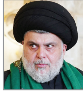
ومطالبة العدو الصهيوني بوقف فوري لإطلاق النار دون قيد أو شرط، وكل ذلك يمثل ضمير الأمم والشعوب الحرة".