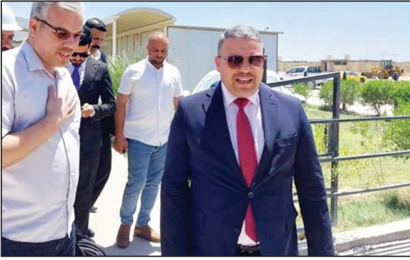
مهام الدوائر التنفيذية في بغداد، لكن بعض الدوائر تنفذ مهامها بشكل غير صحيح، إجراءات مشددة للحد من تلك الحالات وبعضها تنفذها بشكل بطيء جداً، ولدنيا

محافظ بغداد الجديد عبد المطلب العلوي قام بزيارات ميدانية لحل بعض الإشكالات في بعض المشاريع، بحسب المطبلي الذي لفت إلى أن «الكثير من المشاريع الخدمية في بغداد تم استئناف العمل بها بعد تشكيل الحكومة المحلية.