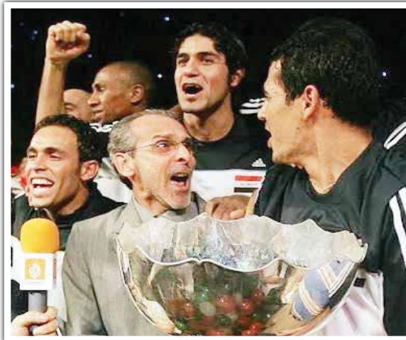
بغداد/ متابعة الزوراء أكد مدرب منتخبنا الوطني الفائز بكأس آسيا عام 2007 جورفان فييرا أن الشعب العراقي لا يعيش كرة القدم بل يعيشها يوماً، واللاعب هناك يولد ويتطور في الشارع قبل الوصول إلى الأندية. وقال: توليت تدريب العراق عام 2007 في ظروف حرب قاسية؛ حيث فقد أغلب اللاعبين أقاربهم، وكان هدفاً للأول والممانعة، مبيهاً: "ان التنوع بكأس آسيا 2007 سيغني الإنجاز الأهم في مسيرتي، والفضل الأكبر فيه يعود لكتيبة اللاعبين المميزين الذين قدّمتم". وتابع "ان سماع العراقيين وهم يصفونني بـ "أسطورة" هو أكثر ما أعز به في حياتي؛ فانساناً الذي يأبى على وجوههم لا تقدر بمن". وفي سياق متصل، أكد المدرب فيليب تروسيه أن منتخبنا الوطني أحد أفضل الفرق في آسيا صلباً وفعالاً، وليس كالإيران بل يعتمد على الثقافة والتحويلات السريعة، ويحتاج فقط إلى مزيد من الضجيج والتعبئة. وأضاف "ان فلسفة أرنولد أثبتت ان الانضباط الدفاعي والتحكم العاطفي يقلصان الفجوة أمام كبار، وهذا ما يحتاجه العراق بجانب روحه القتالية". وبين "ان رسالتي الى لاعبي العراق هي ان لا تدعوا بطولة واحدة تحدد مسيرتكم، فالعرب في كأس العالم إنجاز والخبرة تكسب من الممانعة". وزاد "ان رسالتي للجماهير العراقية، أقول فيها ان خيبة الأمل أمر طبيعي لأن التوقعات والشك في العراق مرتفعان للغاية، لكن هذا الفريق يستحق الدعم ليس فقط عندما يفوز؛ بل وأيضاً عندما يعاني. لقد أظهرت كرة القدم العراقية تقدماً كبيراً في السنوات الأخيرة، ولا يزال العديد من اللاعبين يكتسبون الخبرة