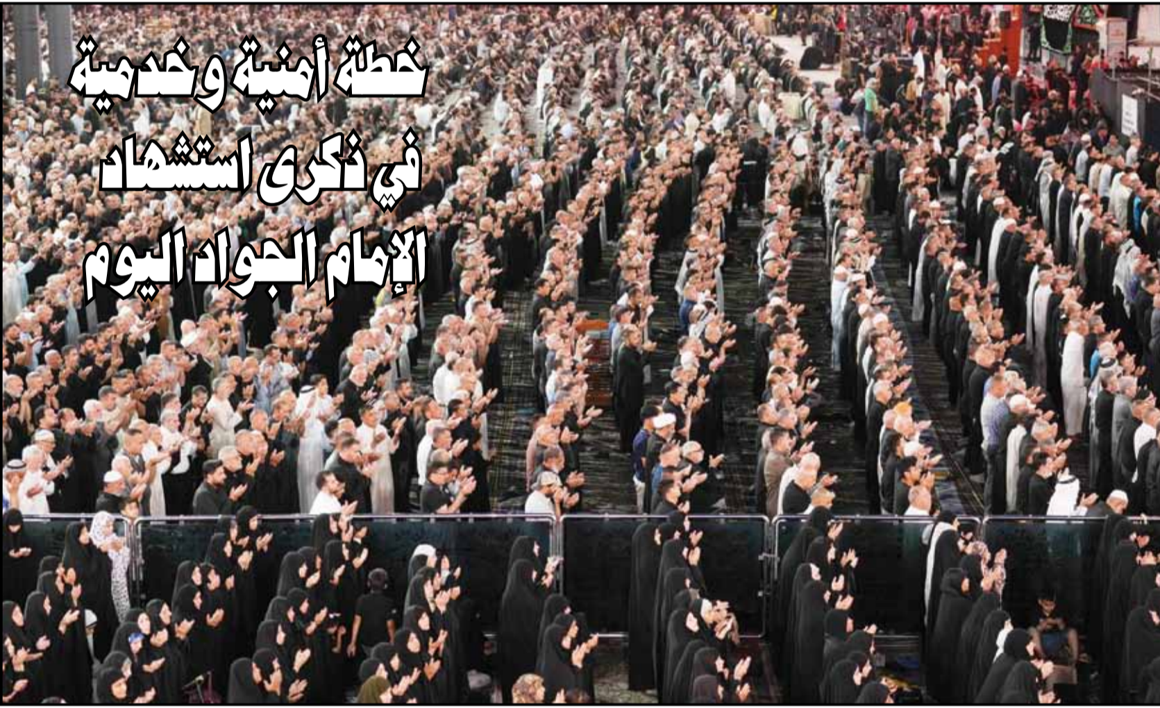
جموع الزائرين يؤدون الصلاة في الكاظمية ليلة أمس