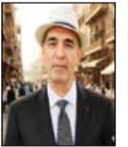
كتب رياض الفاروقي

الانتصار. لكن هذا النمط له ثمن باهظ. حين يعتاد الإنسان على تجنب الخطر فقط، يفقد قدرته على المبادرة. يصبح بارعاً في الهروب، لكنه عاجز عن البناء. يشبه عداء لا يعرف إلا الركض، حتى لو لم يعد هناك من يطارده. وهنا تكمن المفارقة، الخطر لا يختفي حين المؤرخ اللبناني كمال الصليبي كتب مرة أن المجتمعات التي تعيش صراعات طويلة تعيد إنتاج أزماتها حتى في غياب أسبابها المباشرة. وهذا ما نراه بوضوح، الخوف يتحول إلى ثقافة، والقلق إلى عادة، والريبة إلى أسلوب حياة. الناس لا يحتاجون إلى تهديد حقيقي كي يتصرفوا كأنهم مهددون. في الشارع، تتجلى هذه الحالة بوضوح. أبسط احتكاك يمكن أن يتحول إلى نزاع، ليس لأن القضية كبيرة، بل لأن الأعصاب مشدودة دائماً. كل شخص يحمل داخله